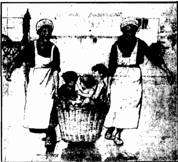
Na plaży w Deauville kąpielowe odnoszą do domu zamilowanych a opornych kąpielowiczów.