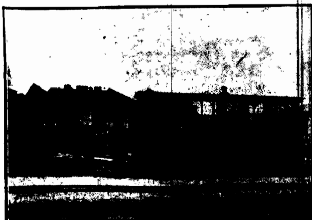
PRZED 30 LATY wagon koczowy.