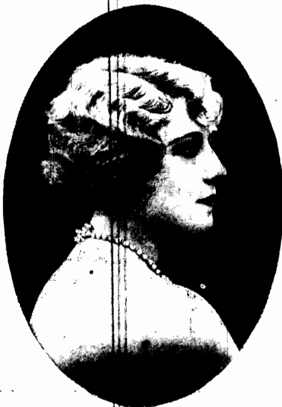
Twarz młoda, a włosy białe, jak srebro. Co tu kłamię: twarz, czy włosy? Oczywiście włosy, bowiem jest to „ostatni krzyk mody” daryskiej: peruczka z siwych włosów.