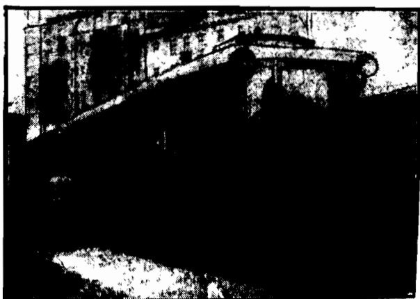
DZIS wagon motorowy.