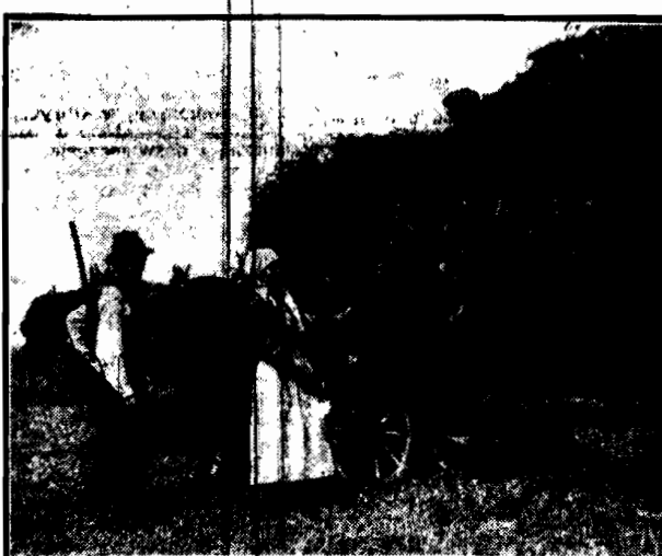
Resztki z pola.