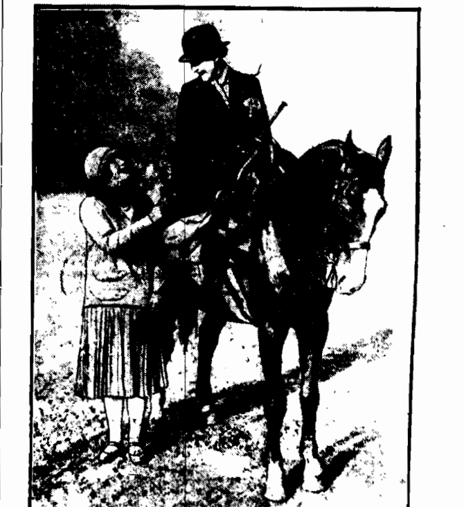
Znana sportsmenka francuska księżna d'Orange wyruszyła konno w podróż po Europie. Na zdjęciu księżna, opuszczając Paryż, zegnana z jedną z przyjaciółek.