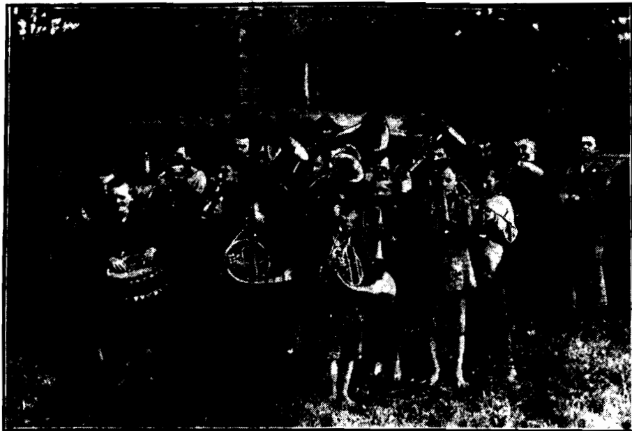
Wychowankowie zakładu dla chłopców w Studziencu mają własną orkiestrę. Mali muzykanci w zamilowaniem wygrywają na niewiele co mniejszych od nich instrumentach skoczne melodie.