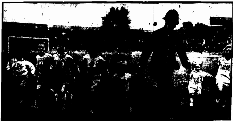
Zwycięzcy w różnych biegach defilują przed publicznością, przyczem najmłodszych championów prowadzi doborliwy policjant.