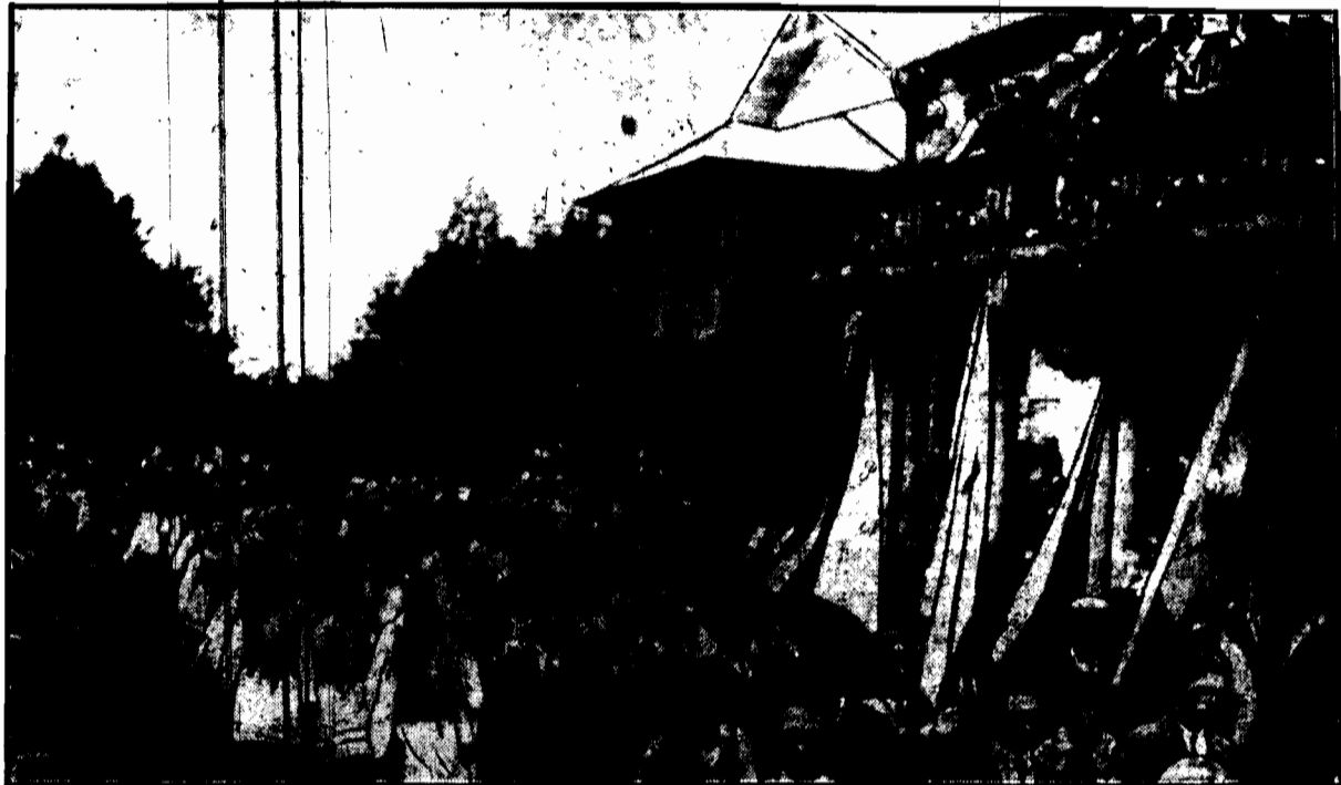
Ziemia lubelska w marszku powitalnym przed Panem Prezydentem, stojącym na schodkach ganku swej letniej rezydencji.