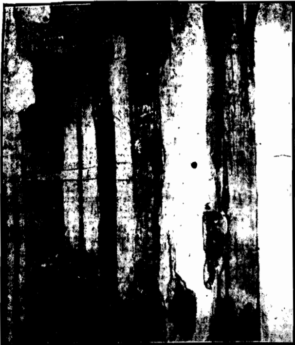
Historyczna cela w X pawilonie Cytadeli warszawskiej, w której więziony był przed 27 laty Marszałek Piłsudski. Cela ta jest dziś całkowitą ruiną i domaga się natychmiastowej odbudowy. (Do artykułu na str. 2-giej).