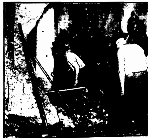
Straż ocalona usiłowuje zgruzytą stację kolei podziemnej, zniszczonej wybuchem bomby.