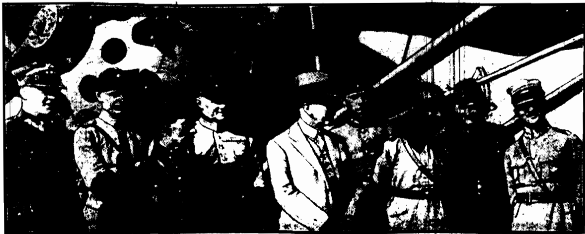
g rewizyta u polskich lotników.