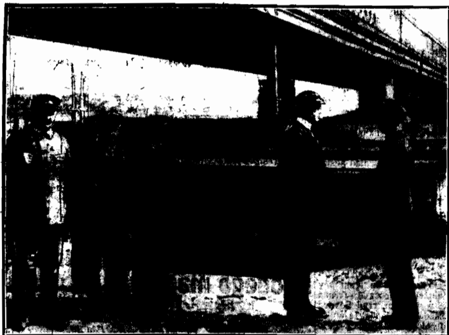
Wioślarze warszawscy pełnią straż przy moście Kierbedzia w Warszawie.