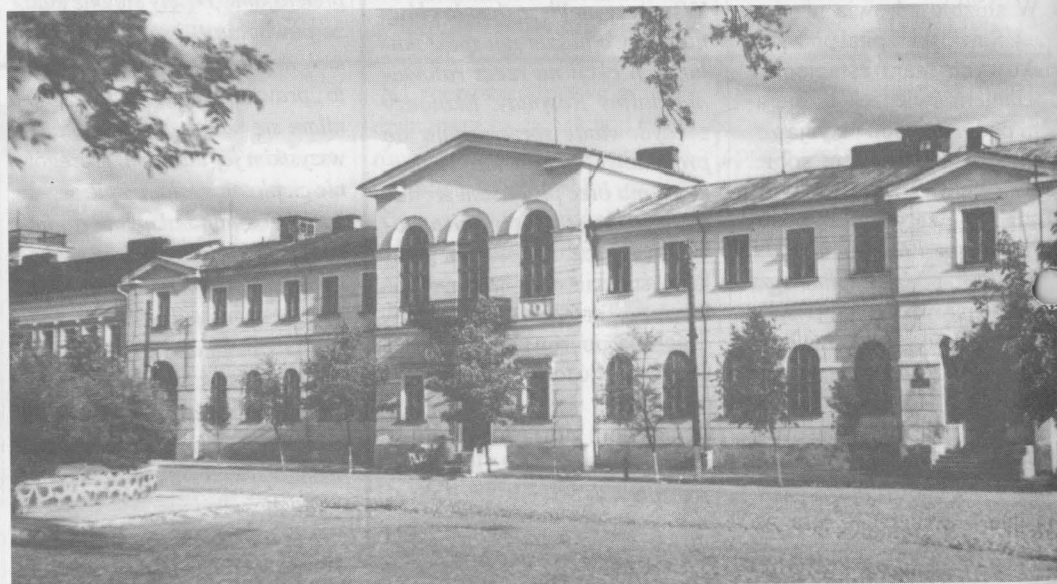
Budynek dawnego gimnazjum gubernialnego, a obecnie Liceum Ogólnokształcące nr 1 im. Marii Konopnickiej, lata 60.

- Na rogach ulic umieszczono tabliczki z nazwami tych ulic. Dziwi nas, że nie zgadza-