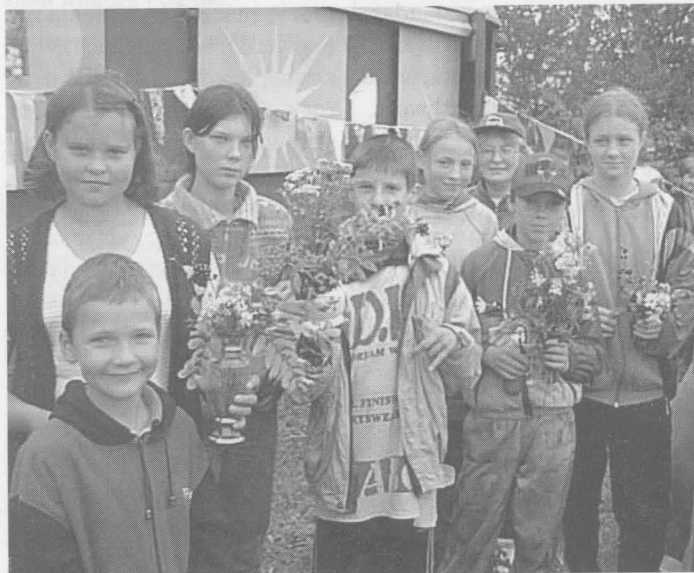
Dzieci uczestniczyły w konkursie na najpiękniejszy bukiet jesiennych kwiatów.

Tradycyjnym zwyczajem podczas Święta Plonów w sobotę, 9 września br., przy wspólnym ognisku spotkali się działkowcy z trzech ogrodów położonych na osiedlu Północ - „Jaćwinków”, „Malinki” i „Borówki”.