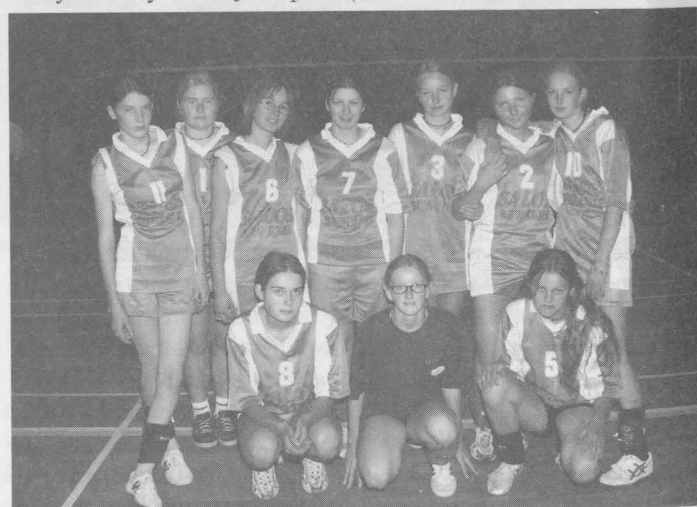
Najlepsze na igrzyskach siatkarki z Suwałk.