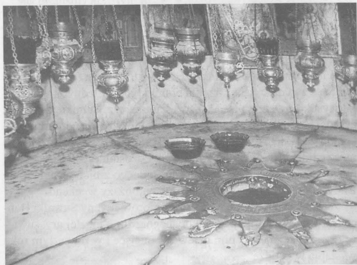
Bazylika Narodzenia Pańskiego w Betlejem.