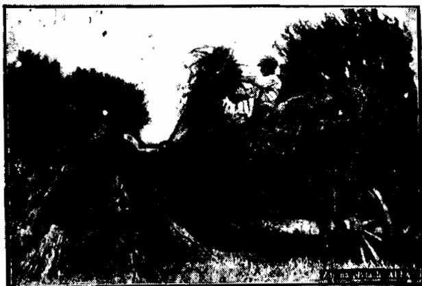
W złotym słońcu upalnych dni lipcowych kładą się pełne kłosy żyta i pszenicy, żłte kosą żniwiarza. Bedzie chleb podczas długiej zimy dla milionowej Warszawy!