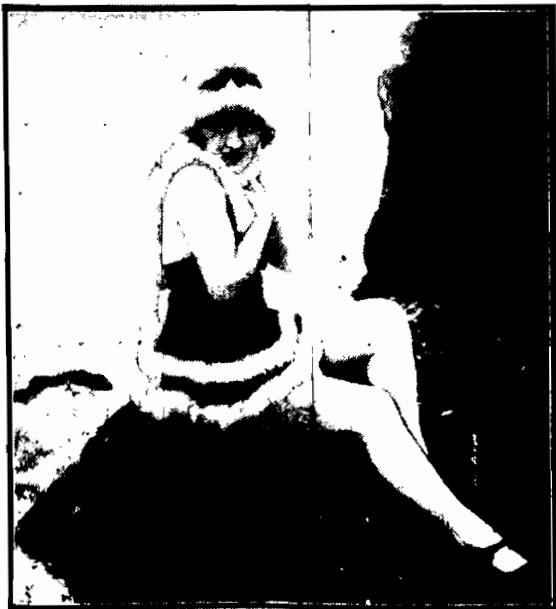
Zahartowana bywałymi plaży nie daje się odstraszyć niską temperaturą i wichrem. Wyzyskuje tylko tę okoliczność, by włożyć nowy kostium kąpielowy, obramowany białym futerkiem.