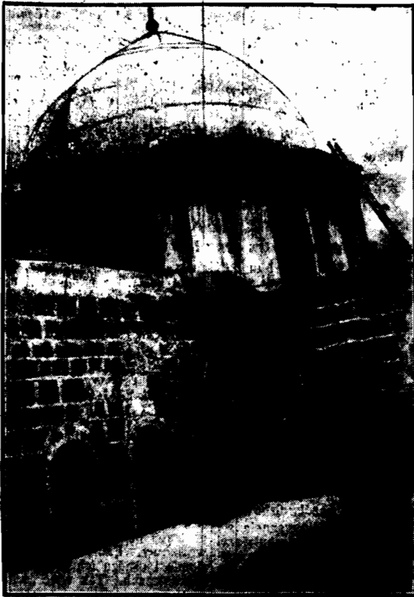
Kopuła Świętego Grobu jest tak uszkodzona wskutek ostatniego trzęsienia, że grozi upadkiem