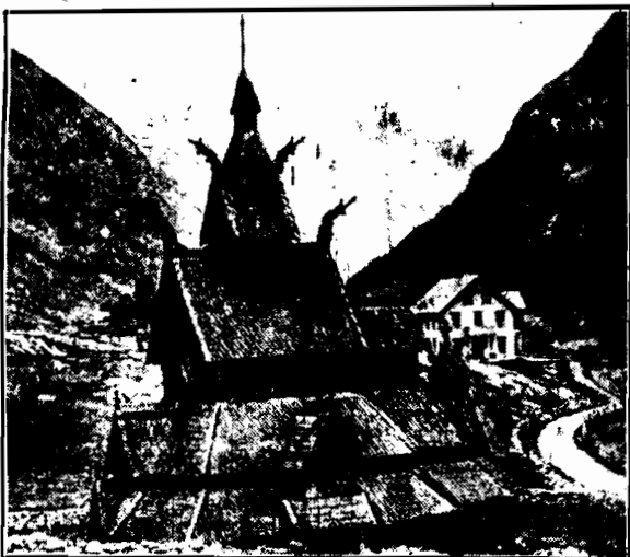
stoi we wsi Borgund, w pobliżu miasta Aalesund, zbudowany w 1150 roku, a więc liczący obecnie 777 lat. Kościół ten jest jednym z najcenniejszych, a zarazem najtypowszych zabytków pierwotnej sztuki norweskiej.