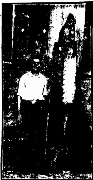
schwyty w Niemnie, pod Grodnem. Waży 120 klg., długości 2 metry 69 cm., w obwodzie 97 cm.