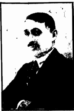
interesującej powieści na tle współczesnego życia akademickiego.