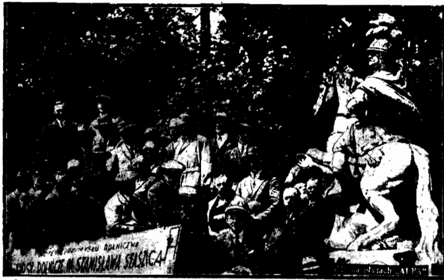
Stuchacze rolniczych kursów korespondencyjnych im. Stanisława Staszica odbyli zjazd w Warszawie. Na zdjęciu grupa kursistów pod pomnikiem Sobieskiego.