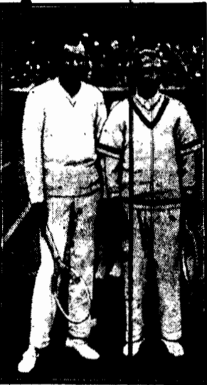
Na międzynarodowym turnieju tenisowym w Paryżu, zwyciężył francuski Lacoste pobili najgroźniejszego współzawodnika Tildena (po lewej).