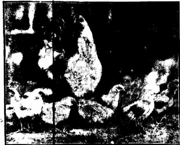
Coś się tam rusza w głębi dziedzińca, więc zanepokożona kwocka patrzy bacznie, gotowa stanąć w obronie swych pisklat.