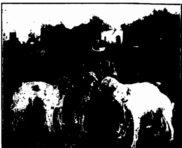
Piękną czwórkę chartów posiada 1 pułk szwoleżerów. I one weźną udział w „Wesołej Paradzie” którą urządzają szwoleżerowie w Ławach w Warszawie.