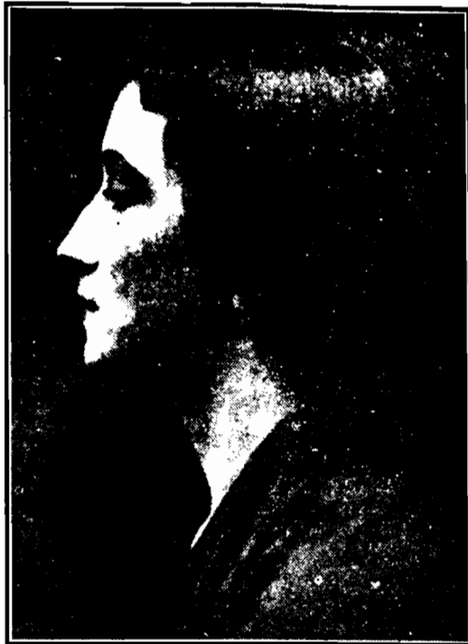
Włosy noszone w kształcie czapki faszystowskiej przez Włoszkę w Nowym Jorku.