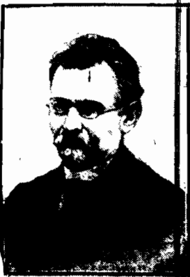
BOLESŁAW PRUSA (Aleksandra Głowackiego)

W dniu dzisiejszym 19 maja przypada 13-ty rocznica zgonu