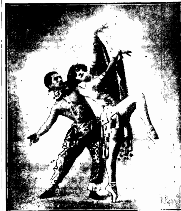
Pp. Pirnkoff, aktorzy teatru czeskiego.

Skórki na kołnierze damskie pochodzą z cieląt przedwcześnie wydanych na świat, handlarze więc wywołują u krów poronienia, co powoduje choroby a niekiedy i śmierć tych zwierząt.