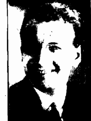
tenor teatru „Metropolitański Revue”, występował z zespołem w Warszawie