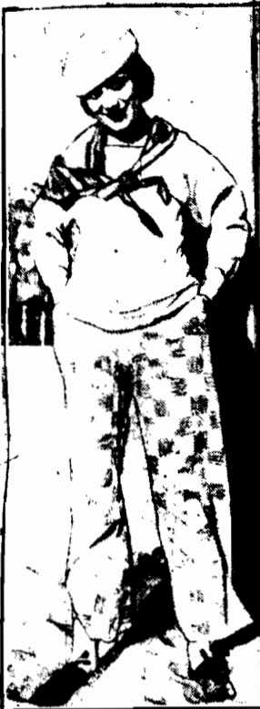
Kosm. damski, noszony na plażach, a nawet i letniakach amerykańskich.