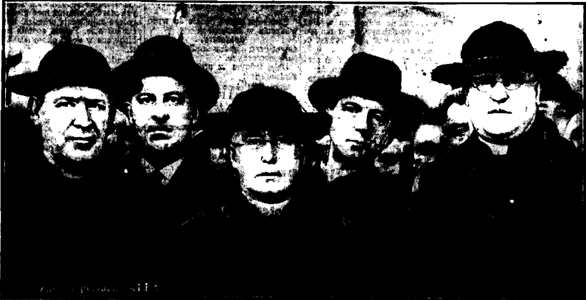
Prymas Anglii, ks. kardynał Bourne na dworcu. Przy nim z jednej strony ks. biskup połowy Gall, z drugiej ks. kardynał Kakowski.