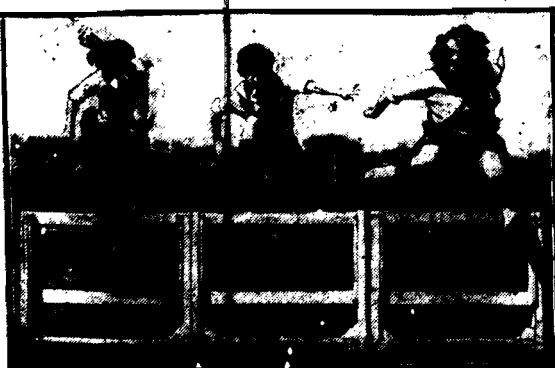
Studentki uniwersytetu w Kansas (St. Zjedn.) przy treningu w skokach.