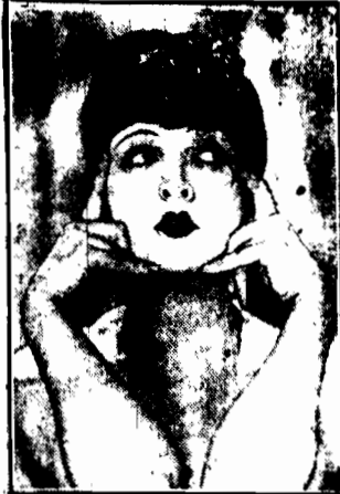
Ostatnia fotografia znanej artystki filmowej Lyi de Puti.