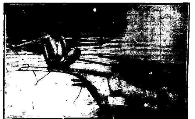
Krajowiec wysp Andamańskich przy polowaniu na żółwia na pomoc dąbki.