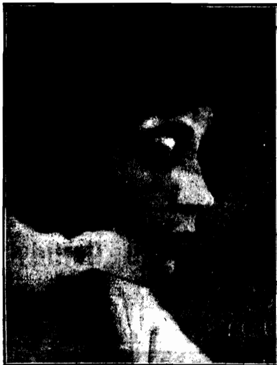
Renee Adoree, głośna francuska artystka filmowa.