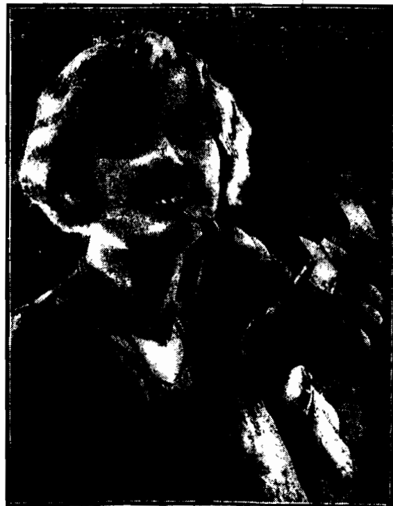
Pomadka do ust, chroniąca je od pokania... Pomysłowy wynalazca wynalazł też w podobny sposób o słowach nie a śladu leża z taciśi oszczęd.