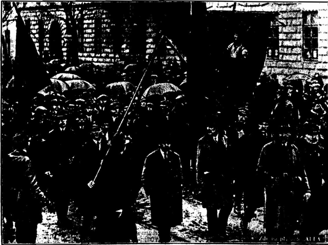
Fragment pochodu ze sztandarem kolejarzy na Krak. Przedmieściu.