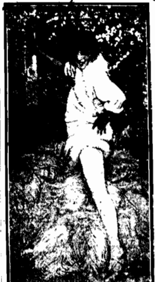
„MISTINGUETTE” w nowej rewii Moulin Rouge