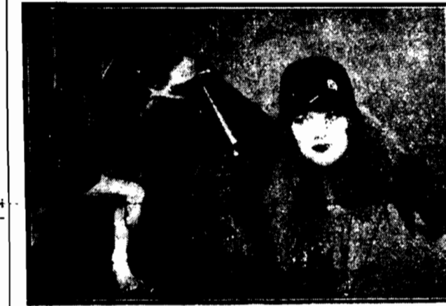
Dog artystki filmowej Mildred Davis, żony Harolda Lloyd'a, jest tak wytresowany, że bierze w pysk tubę reżysera i szczeka