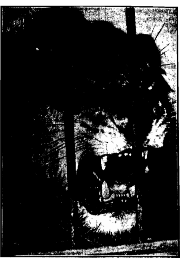
Tak wygląda gniewne oblicze z za kratki króla zwierząt