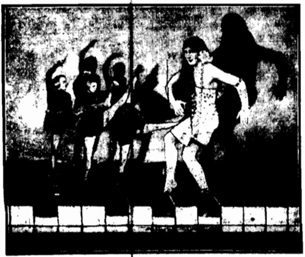
Tancerka z lalkami tańczy w takt muzyki granej własnymi nogami na specjalnym fortepianie.