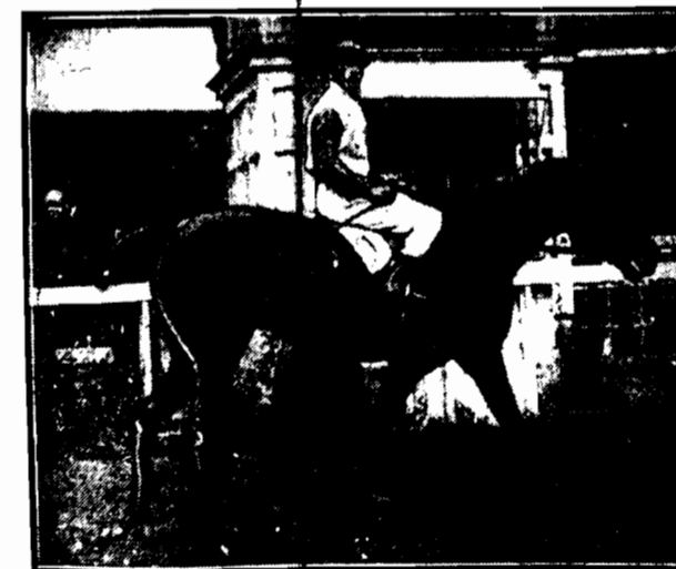
Ten p. Br. Szwajcera pod dłońmi Doroszem. Zwycięzca nagr. im. Przydona Rzeczypospolitej. Jeden z najpoważniejszych kandydatów do nagrody im. Szwajcera.