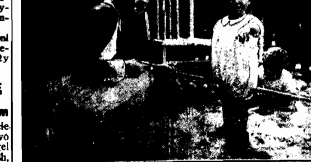
Zona Charlie Chaplina po wielu nieporozumieniach ma zamierzać wrócić wraz z dziećmi do matki i ojca