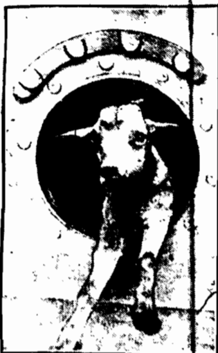
Koza „Billy”, maskota amerykańskiego krążownika „Tallapoosa”