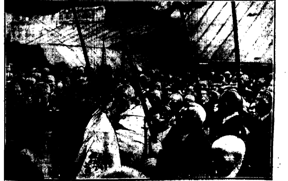
W niedzielę odbył się w kościele S-go Wojciecha na Woli pierwszy odpust. Na zdjęciu celebrans pod baldachimem, otoczony przez wiernych obywateli.