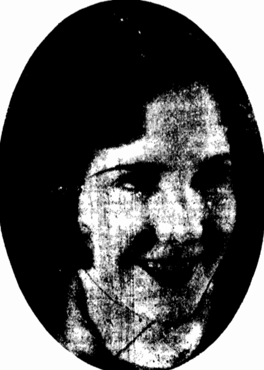
Mary Brian z „Paramountu”