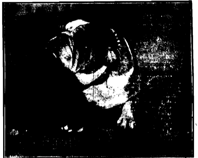
smacznie drzemią pod czujną opieką przyjaciela — kaczki