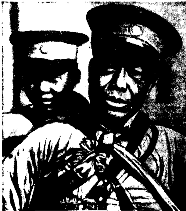
Żołnierze armii karntońskiej, która zdobyła Szanghaj