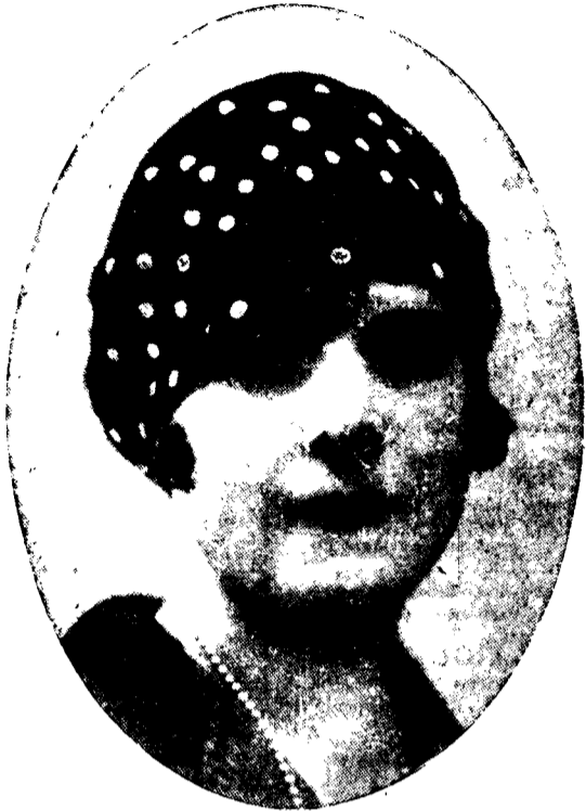
Węgierski toczek z granatowego jedwabiu w białe grochy