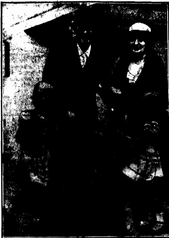
Dwój polskie dziewczynki w strojach narodowych powitały w Sidney (w Australji) przybyłego na koncert Ignacego Paderewskiego i jego małżonkę, wcielając imieniem miejscowej kolonii polskiej wieniec z napisem: „WIELKIEMU PATRIJCIE — POLACY W AUSTRALJI”