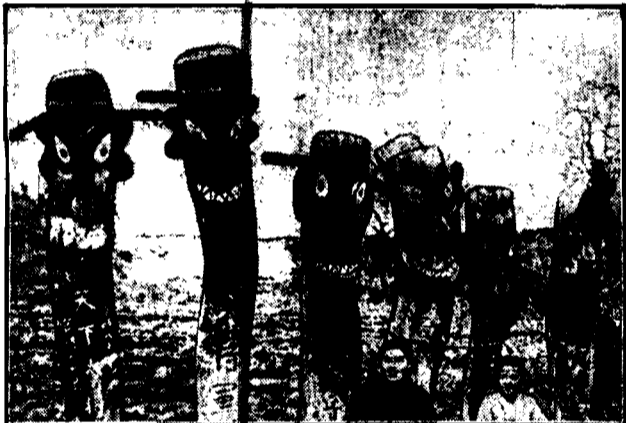
Fantastyczne figury bożków według wierzeń Koreańczyków, ochraniają wioskę od choroby