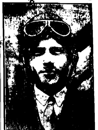
ma zamiar uskuteczyć lot Nowy Jork — Paryż na aparacie jednomiejscowym. Kpt. L. ubiega się o nagrodę w wysokości 25 tysięcy dolarów.