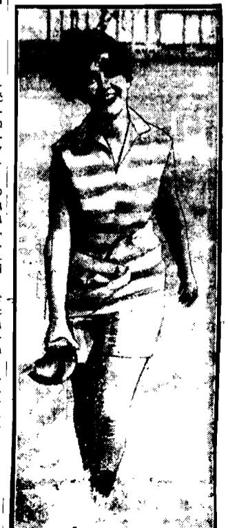
Kostium kąpielowy w białym i czerwonym pasie, przepasany białym pasem miedzi