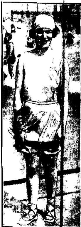
Kostium kąpielowy z białego jedwabiu: długi dzianop ozdobiony trenażką jedwabną i malinową