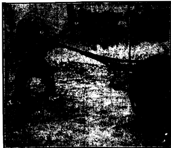
„Morderca” orangutan z londyńskiego ogrodu zoologicznego. Z samolotem walczył ależ tego okroci.