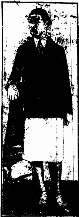
„LA GARÇON” demny zakieciak - marynarka i jasna flanelowa spódniczka