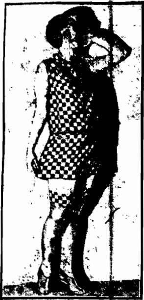
najnowszy model paryski