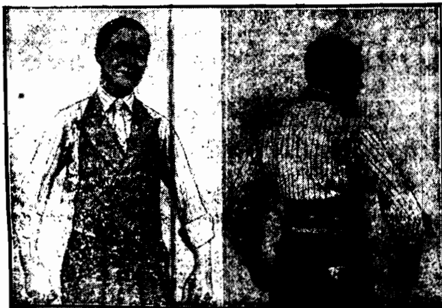
Kamizelka letnia bez pleców wchodzi obecnie w modę w Ameryce.