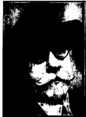
Wacławowi Sieroszewskiemu. Jedynym kontrkandydatem był Artur Oppman (Or-Or).

Wacław Sieroszewski WARSZAWA, 9.4. Wczoraj wieczorem jury nagrody literackiej m. Warszawy przyznało nagrodę w wysokości 15.000 zł. znakomitemu powieściopisarzowi