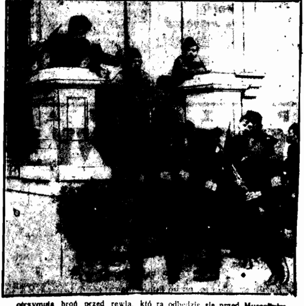
przymiata broń przed rewją, kto na odhuczyć się przed Museolinim.