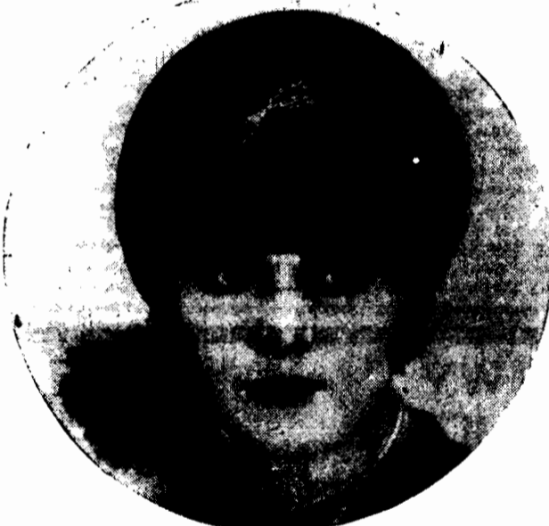
Elegancki kapelusik z czarnej satyny z pokiem krótkich crossów z boku, ozdobiony brylantową egretą