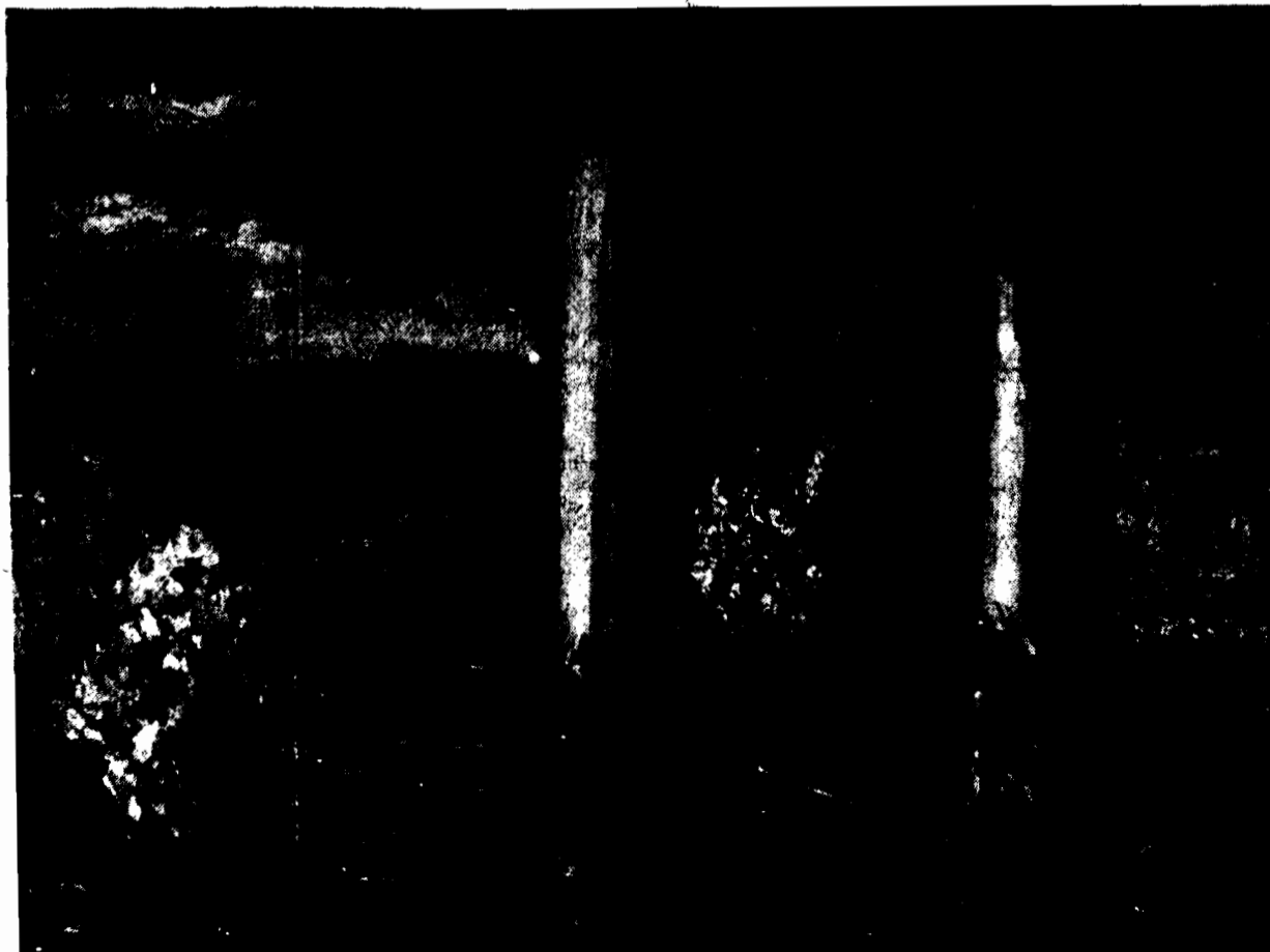
Widok z ogrodu pałacu w Warszawie