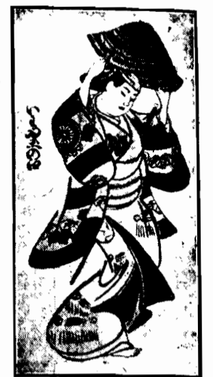
Niedawno udało się przetelegrafować z Berlina do Wiednia obrazek powyższy

sterczą korny fabryki, pedzą automobile. Nowocześni, wykształceni Chińczycy powoli opanowują i te zdobycze, by je użytkować kłedyś dla własnych, ukrytych przed okiem Europejczyka, celów.