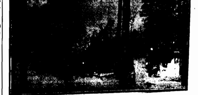
Zarys na śniegu szczytów w Laponii