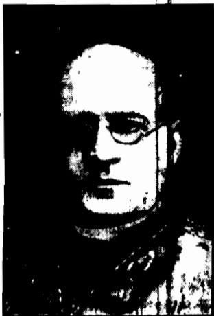
W dniu 31 b. m. kończy 70 lat swego bogobojnego życia