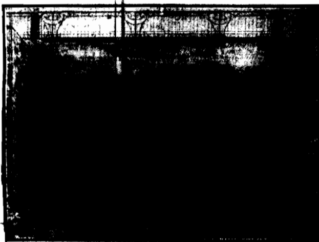
WYŚCIE DO TUNELU w wylociu ulicy Smolnej przy skrzyżowaniu z Młokami