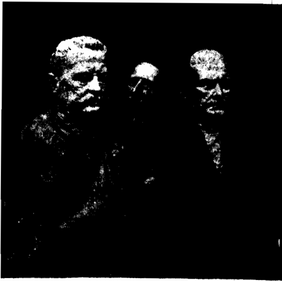
Figury woskowe dyktatora Włoch i prezydenta Niemiec w pomocy-kum Fussana w Londynie