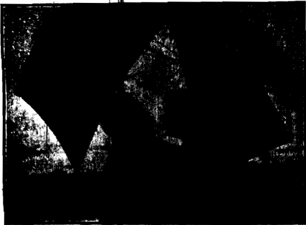
Zdjęcie bardzo niebezpieczne wobec zbliżającej się wiosny