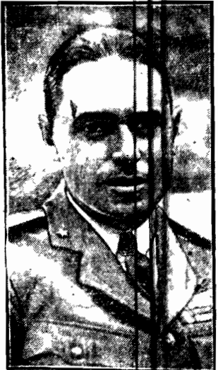
Lotnik w służbie Ocean, wycieczający z Ameryki do Afryki. Leciał on nad oceanem w dniu 17 września 2000 r.

Jest bardzo łagodnym i dobrotliwym stworzeniem i posiada wiele szlacheńskich upodobań.