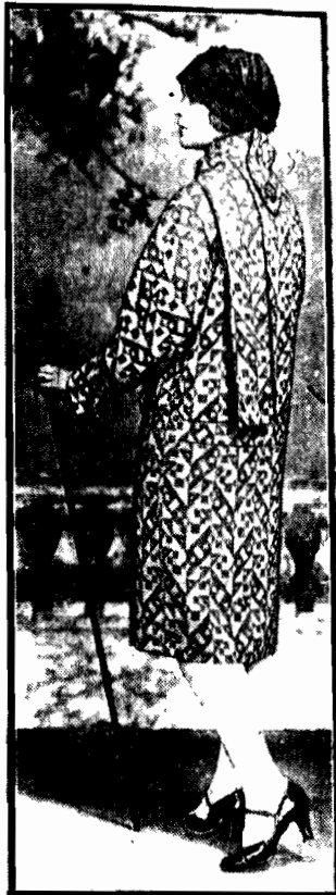
Orginalny płaszcz z materiału w deseni i kolierzem w kształcie szalika.