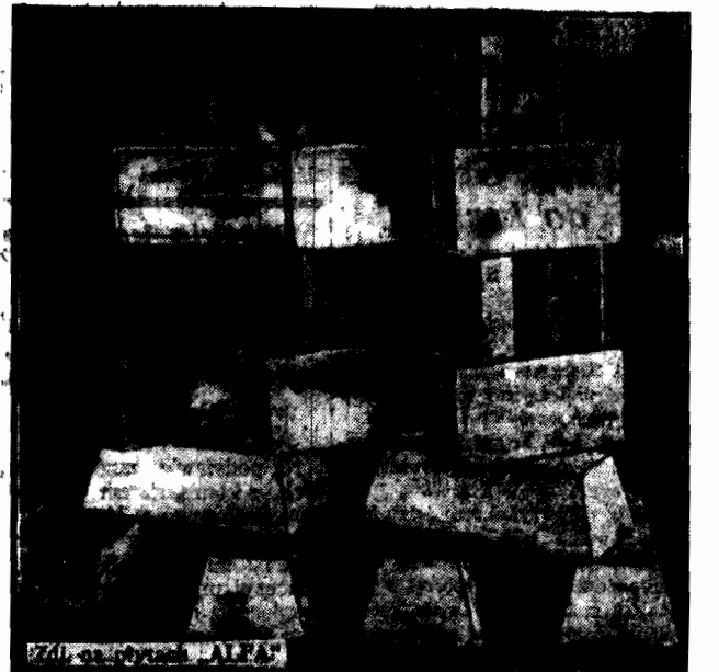
Miljon złotych w złocie. Tworzy go p. j. sześćdziesiąt sztab złota, każda wartość z górą 60.000 złotych.