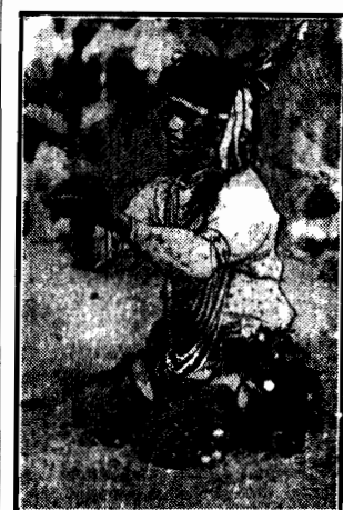
gestami wypędza chorobę z pacjentem. Przypomina to tak zw. passy hipnotyczne.