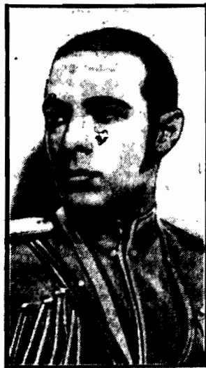
Zmarły artysta filmowy Rudolf Valentini, ulubieniec publiczności kinowej. Śmierć jego pogrążyła w niedużym żalu krocie widzów.