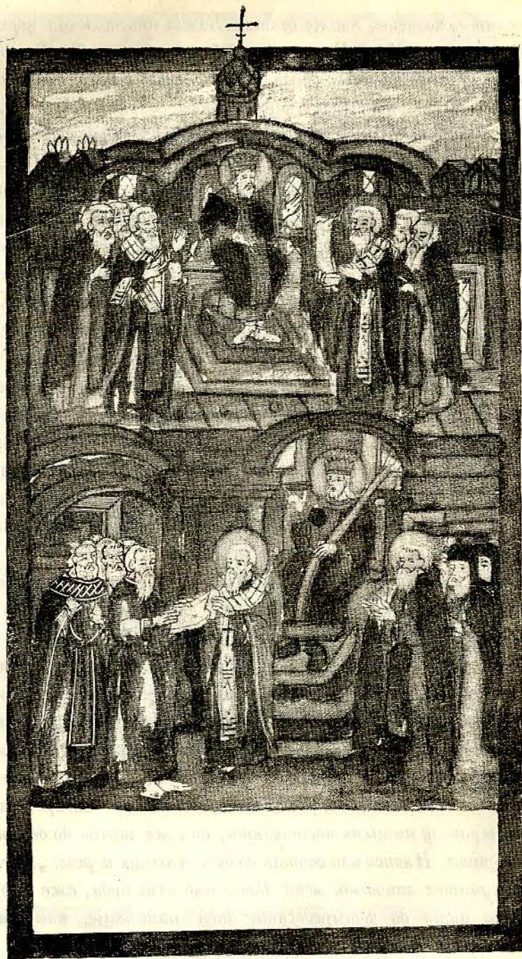
5. Первый вселенский соборъ.

литвы, аще и грѣшны суть усопшихъ души, то отпустъ отъ Бога приимутъ; аще ли суть праведны, то исполнени всякого добра, творящимъ е обогатятся“. И се рекши потче (поставила) посохъ свой, и абіе невидима бысть. И утро же оставши, видѣша посохъ ея процвѣтуущъ и прославиша Бога“.