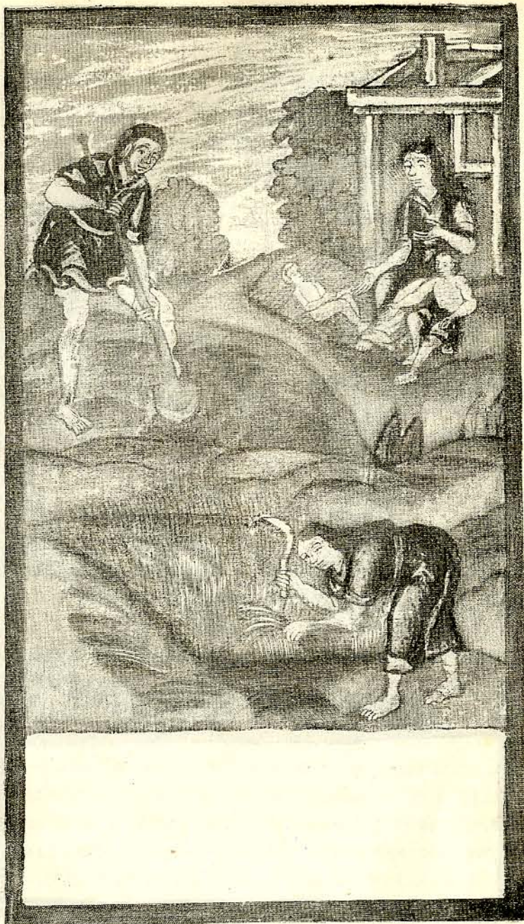
3. Труды Адама и Евы.

На картинѣ грѣхопадѣнія змій изображенъ съ человѣческою головою въ знакъ его мудрости. Картины большею частью составныя такъ, что вверху изображается одинъ сюжетъ, а внизу другой, напримѣръ, какъ Адамъ и Ева работаютъ и въ то же время воспитываютъ дѣтей своихъ.