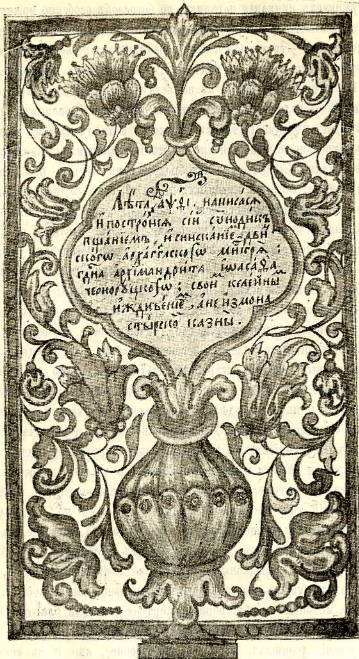
1. Запись о времени составленія Синодика.

Первая часть синодика содержитъ въ себѣ разныя разсужденія и наставленія о поминовеніи усопшихъ; вторая заключаетъ въ себѣ изображеніе въ картинахъ грѣшной человѣческой жизни съ указаніемъ средства къ спасенію въ будущей жизни — чрезъ поминовеніе, а въ третьей находятся разныя помянники. Каждая изъ этихъ частей