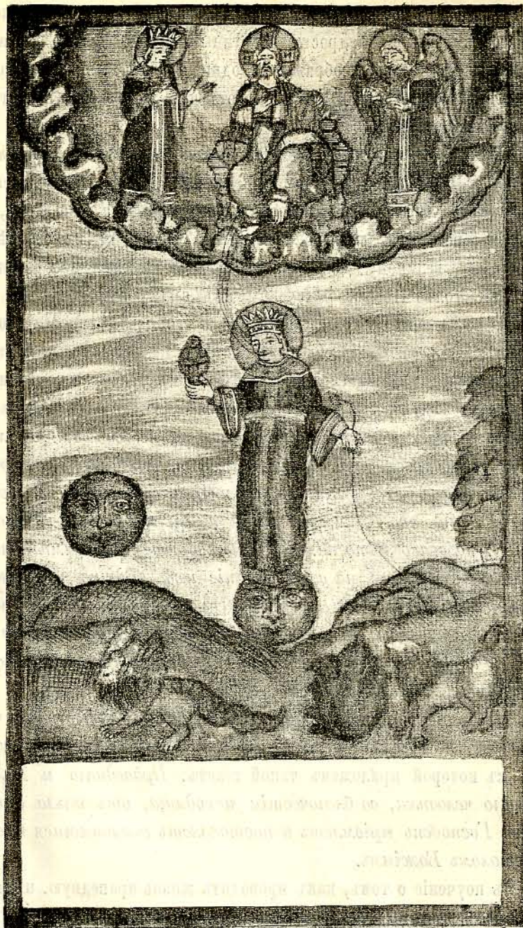
4. Душа чистая.

ственно показывает, якоже святая Божія апостолская церковь вопіетъ на всякъ день: Благословляяй благословящия Тя, Господи, и освящаяй на Тя уповающия, спаси люди Твоя и благослови достояніе Твое, исполненіе церкви Твоея сохрани, освяти любящия благолюбіе дому Твоего. Ты тѣхъ возпрослави божественною Твоею силою и не остави насъ уповающихъ на Тя. И услышавъ сіе ангель Господень радостенъ на небо отходитъ, яко нѣкоторый долъ исправя, и тамо напишетъ имена тѣхъ въ свѣтлыхъ обителехъ въ немерцающемъ свѣтѣ. Снцева есть похвала добръ строящымъ земная, обильно даются небесная“.