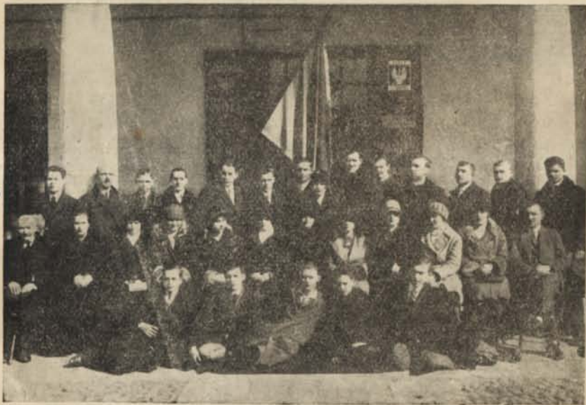
Pracownicy „Zjednoczenia” w 1929 roku.

Przyjemnie się składa, że „Zjednoczenie” za rok sprawozdawczy wypłaci swoim członkom zwiększoną dywidendę w formie 1½% od doko-