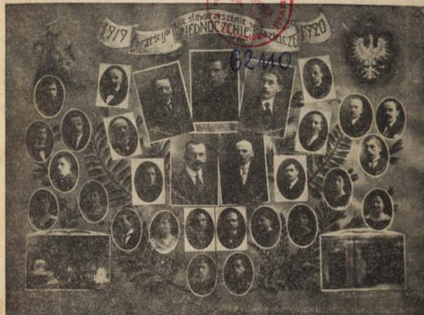
Władze i pracownicy „Zjednoczenia” w 1920 roku.

Kupujcie tylko we własnych sklepach „Zjednoczenia“!