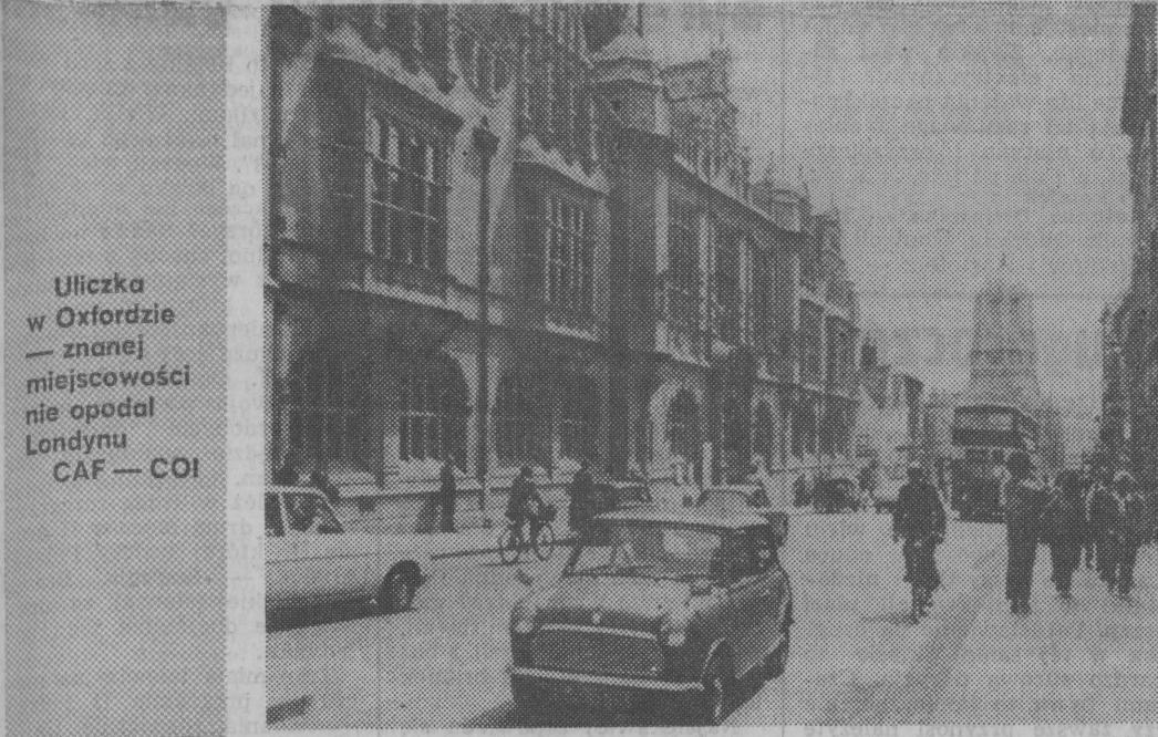
Uliczka w Oxfordzie — znanej miejscowości nie opodal Londynu

Jak podkreślono w ogłoszonym werdykcie, James W. Balck w 1964 r. opracował lek o nazwie Propranolol, stosowany w schorzeniach serca.