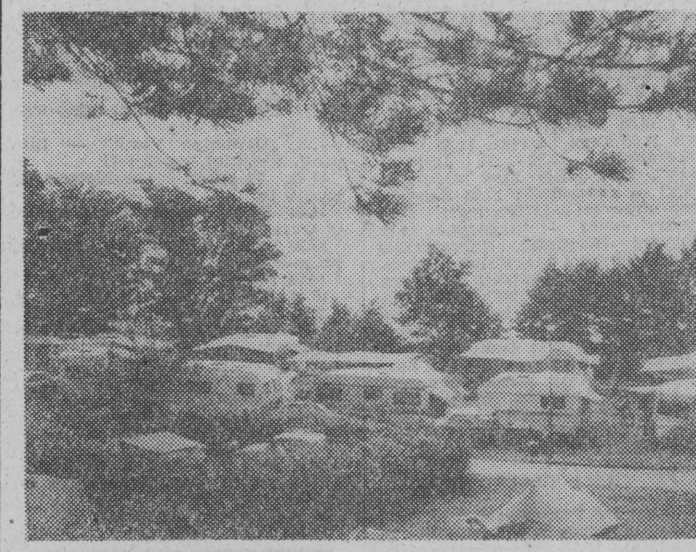
Czy trzeba czuwać przy magazynie?