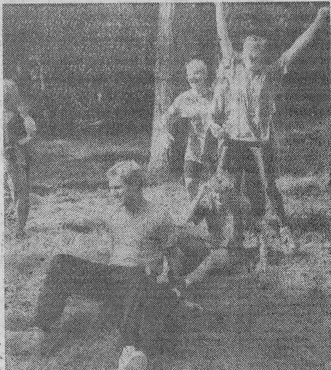
A tak dawiono się, na powietrzu, w ciągłym ruchu w ubiegłą niedzielę.

Wspieramy każdą inicjatywę zmierzającą do uprawiania sportu dla zdrowia. Studio Sportu i Terapii Fitness w Białymstoku (ul. Wyszyńskiego 15) w każdą niedzielę organizuje (bezpłatnie) dla wszystkich chętnych zabawy biegowe w Parku Zwierzynieckim. Zajęcia w przyjemnej i dostępnej formie, prowadzi fachowcy. A zatem warto podnieść się z kocyka. Zbiórka w niedzielę, 22 bm. o godz. 11 na parkingu przed halą AMB (ul. Wołodyjowskiego). (let)