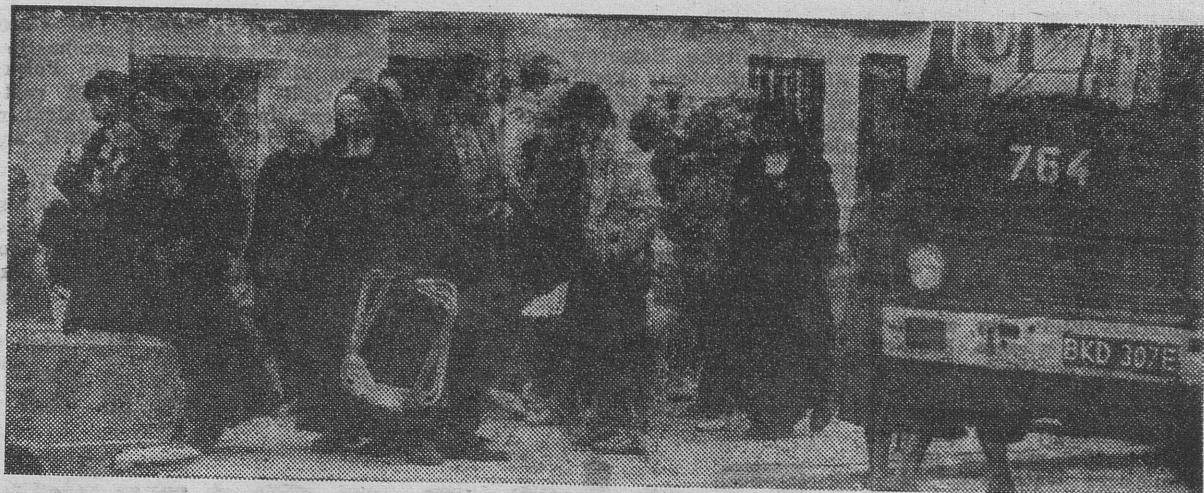
Komunikacja ruszyła — ludzie z przyzwyczajenia chodzą piechotą...

W przypadku wystąpienia opadów deszczu — Jarmark odbędzie się w budynku Ratusza. (dsc)