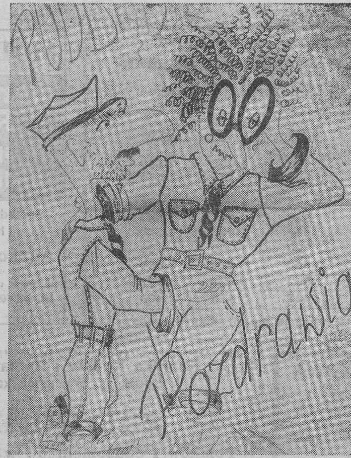
Prosto z nadmorskiego PODDĄBIA, jedynej bazy biaostockich harcerzy — POZDROWIENIA

wiosło. Wioslarze najpierw siedzieli twarzą do dziobu ale, później, gdy na łodziach drewnianych zastosowano dułki, zostali zwrócić twarzą do rufy. Sterowanie odbywało się jednym lub dwoma wiosłami. Łódź trzciniowa była wygodna ze względu na prostotę budowy, bowiem łodcy trzciniowe łatwo było łączyć. Niekorzystne było jednak nasłanianie wodą, dlatego istniała potrzeba czystego suszenia łodzi. Podobne łodzie i tratwy używane są jeszcze dzisiaj we wschodniej Afryce, w rejonie Zatoki Perskiej i Ameryce Północnej.