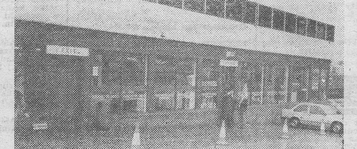
W tym, przypominającym nam „supermarkecie” można kupić wszelkie pamiątki o Manchester United. Tekst i zdjęcia: L. TARASIEWICZ

Jeszcze raz serdecznie dziękuję za te wspaniałe chwile i do zobaczenia na... sportowych obiektach.