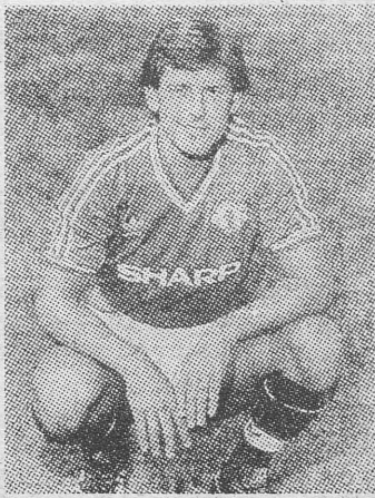
Niestety, w meczu Legia - Manchester United nie zobaczymy w Warszawie czołowego piłkarza gości, BRYANA ROBSONA.

Z uwagi na fakt, iż żądni rewanżu — za porażkę 0:3 w Gdańsku — szkoleniowcy i piłkarze Jagiellonii zapowiadają grę o zwycięstwo, na stadionie przy ul. Jurowieckiej (godz. 15) zanosi się na ciekawe widowisko. (szer)