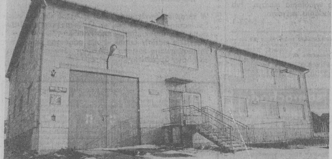
W tym budynku skupia się życie kulturalne wsi.

Warto dodać, że podczas tego samego podsumowania, Zarząd Wojewódzki TKKF w Łomży został wyróżniony specjalnym pucharem za aktywną działalność i ciekawe inicjatywy.