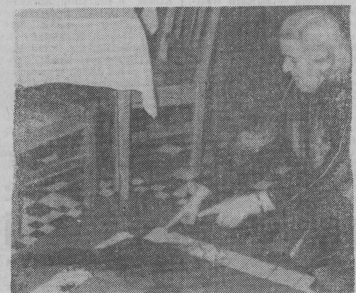
Jadalnia Państwowego Domu Pomocy Społecznej dla Dorosłych w Suwałkach. Plama na podłodze to krew. Tu zaatakowane zostały pierwsze ofiary.