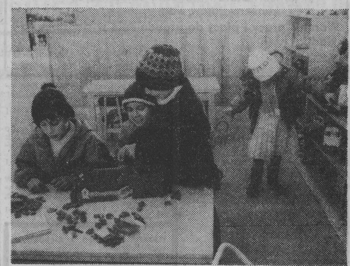
Miniprzedskole, to udogodnienie dla rodziców. Dzieci mają tu rím do dyspozycji zabawki oraz zapewnioną opiekę.

Wielki finał przypada we wtorek, 10 listopada. W trakcie: dyskoteka, konkurs piosenki, występy parodystów, konkurs tańca disco, wybory Miss Internalii oraz rozdanie nagród. Zabawa więc zapowiada się pyszną. (tol)