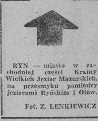
RYBN — miasto w zachodniej części Krainy Wielkich Jezior Mazurskich, na przemyśle pomiędzy jeziorami Ryńskim i Ołtow.

Spółdzielnie Kółek Rolniczych w woj. łomżyńskim zatrudniają ponad 2,1 tys. osób. Stanowi to około 30 proc. wszystkich pracowników upublicznionego rolnictwa i leśnictwa w województwie. Do PZPR należy ponad 18 proc. zatrudnionych i tylko w SKR w Wysokiem Mazowieckim, Zawadach, Perlejewie, Długoborzu, Jenkach i Czarkówce nie ma w ogóle członków partii.