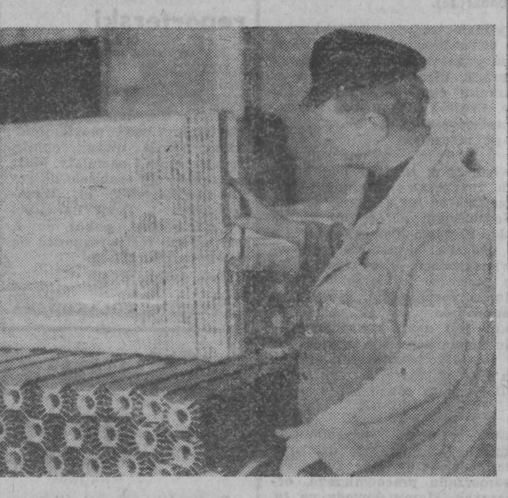
Lato jest tak chłodne, że zaczynamy już myśleć o zimie i grzejnikach.

Scotland Yard ujął 5 gangsterów, którzy 12 lipca dokonali jednego z największych rabunków, okradając sejfy jednego z londyńskich banków. Lupem złodziej padły pieniądze i kosztowności na sumę ponad 20 milionów funtów szterlingów. Dokładnej wysokości łupu jeszcze nie ustalono — 196 właścicieli sejfów nie zgłosiło — jak dotąd — policji, co właściwie zostało im skradzione. Największym „sokodem” w W. Brytanii dokonano 10 sierpnia 1983 roku na londyńskim lotnisku Heathrow. Po steroryzowaniu strażników uzbrojeni bandyci wynieśli z sejfu spółki ubezpieczeniowej „Brinks-Mat” ponad 3 tony złota wartości, 26 mln funtów. (PAP)