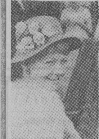
Z cyklu filmy Stanisława Barei, program II zaprezentuje w sobotę 15 sierpnia „Matczyno z rozszadku”