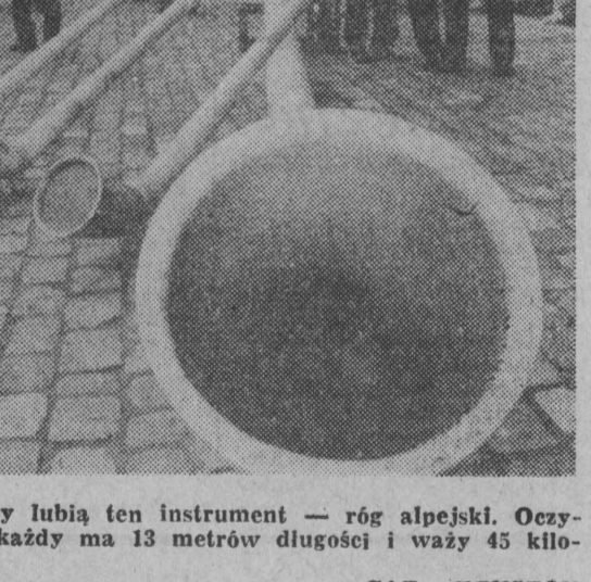
Szwajcarzy lubią ten instrument — róg alpejski. Oczywiście nie każdy ma 13 metrów długości i wazy 45 kilogramów

Garść negatywnych przykładów, których liczba za sprawą izb skarbowych stale się powiększa dowodzi, że w części przedsiębiorstw opacznie rozumie się intencje reformy, za to dość dokładnie