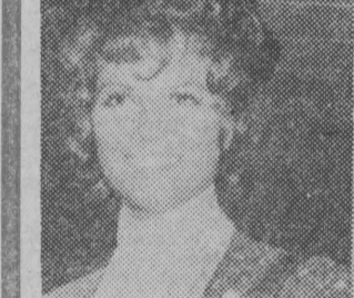
Francuski film pt. „Przysłętego lata” z udziałem C. Cardinale i Jean-Luisa Trintignant zobaczymy 21 sierpnia w programie II