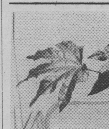
FATSJA JAPONSKA — dostojna przed niespełna miesiąctem ten gatunek pojawił się w białostockich kwiaciarniach.

„Dzieci z tego turnusu są zróżnicowane wiekowo — mówi Zenon Gruszeński. — Musimy więc zapamiętać zajęcia, które zainteresują wszystkich.