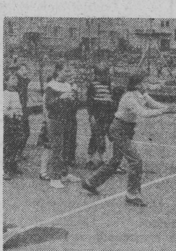
Kto wygrał w tych wyścigach?

Właśnie wody powierzchniowe, będące podstawową częścią środowiska wymagają szczególnej ochrony. Wydatki ze środków budżetowych województwa na ten cel w latach 1983—85 wyniosły 790 milionów złotych. Ich u-