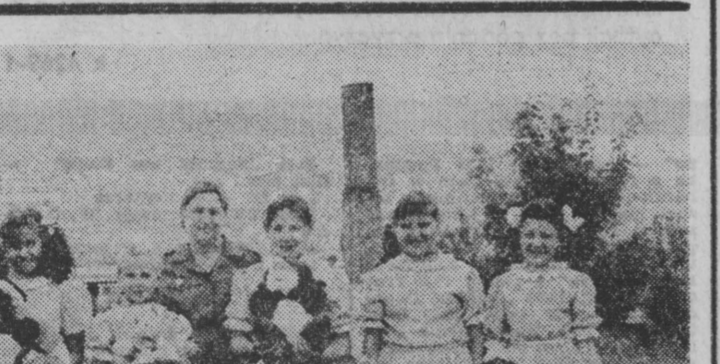
Młodzież Szkolnej w Kielcach. Ale pozdrowienia wraz ze zdjęciem otrzymaliśmy dopiero teraz. Dziękujemy. Życzymy udanych wakacji. (m-1)

Podłaskiego znają dobrze nie tylko bielszczanie. „Wesołe Nutki” — tak nazywa się zespół, zapewne powróciły już z Festiwalu