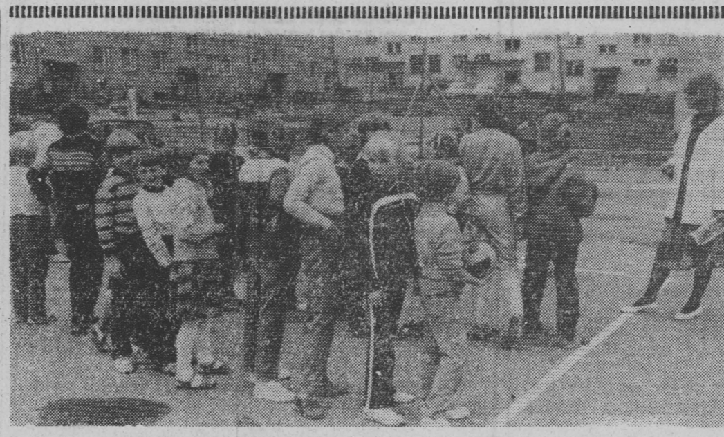
Na spółdzielczej półkolonii nudów nie było.

Ze względu na dojazdy młodzieży do szkół, we wrześniu br. planuje się otworzyć linię do Wolewózki. Ale już teraz dziesięć autobusów komunikacji miejskiej w Gra-