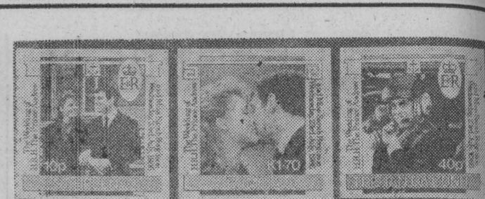
NA ZDJĘCIU: Znaczki z okazji ślubu ks. Andrzeja z Sarah Ferguson.

Żuł zapowiedziały wydanie okolicznościowych znaczków, arkusików i kopert FDC także królewska brytyjska Współ-