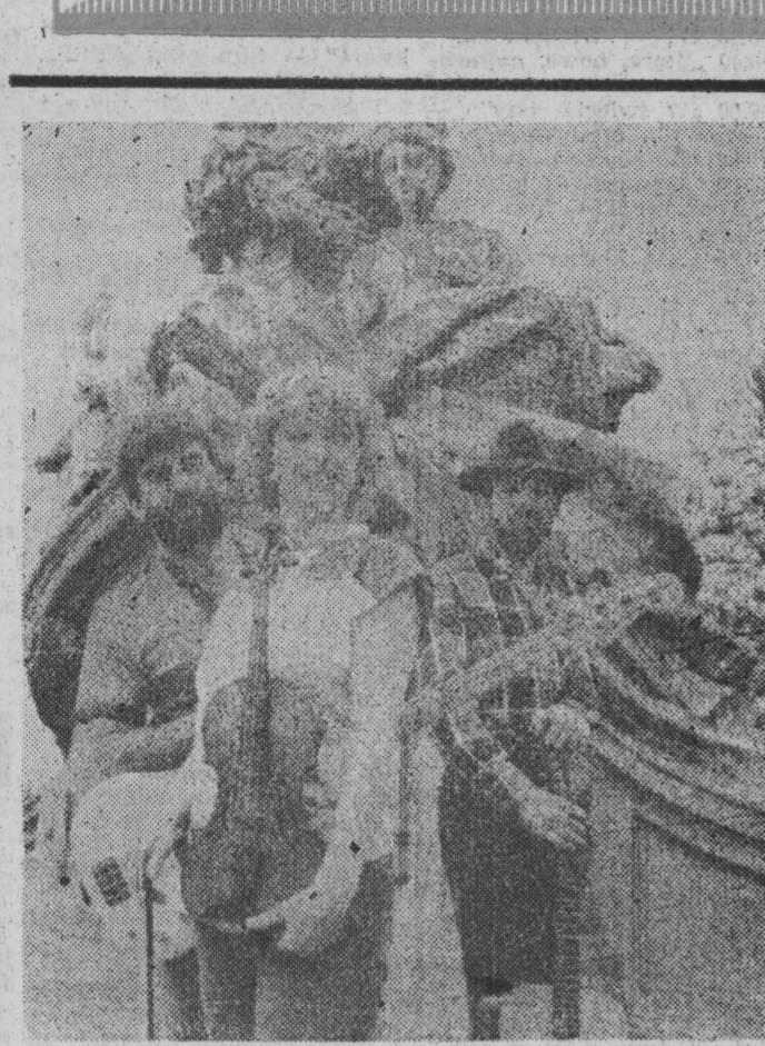
„Gang Marcela”.