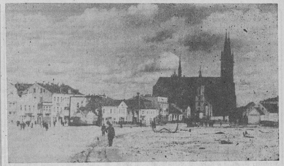
Białystok — rok 1943.

SUWAŃKI , godz. 13 — złoże-nie kwiatów w miejscach pamięci narodowej. PISZ , obóz międzynarodowy pionierów LSR i harcerzy Suwalskiej Chorągwi ZHP — „Dzień Polski i Litwy”. WTOREK, 22 LIPCA PISZ , obóz międzynarodowy pionierów LSR i harcerzy Suwalskiej Chorągwi ZHP — „Dzień Polski i Litwy”. RYN , amfiteatr — wiec mieszkalców. Po części oficjal-nej występ zespołu folklor-ystycznego z Litwy. WYDMYNY — młodzież z Suwalskiego, Litwy i NRD przebywająca na obozie, spot-ka się z radnym WRN. IMPREZY ARTYSTYCZNE SOBOTA, 19 LIPCA SUWAŃKI, plaża OSIR w Krzywem, godz. 15 — kon-cert zespołu folklorystycznego „Borowiński”, występ zespołu muzycznego ze Strzelcowizny; STARY FOLWARK , godz. 16 — występy zespołów kolonij-nych, koncert zespołu „North Pole and jazz band”, dyskoteka; SUWAŃKI, Park Miejski , godz. 19 — koncert zespołów kolonijnych; SUWAŃKI, klub „Suwalsz-cyzna” , godz. 18 — projek-cja filmu „Odwaga w myśle-niu i działaniu”, spotkanie z redaktorem naczelnym „Kra-jowców”, dyskoteka; OLECKO , klub „U Potego-wej”, godz. 12 — projekcja bajki dla dzieci. NIEDZIELA, 20 LIPCA SUWAŃKI, Park Miejski , godz. 14 — koncert zespołów ludowych; SUWAŃKI, klub „Suwal-szczyzna” , godz. 19 — wieczór