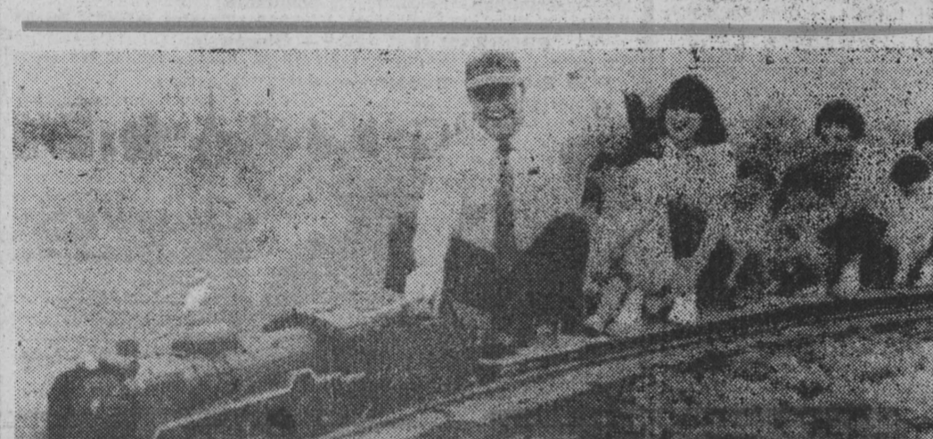
Pasażerowie tej kolejki wypadają się szarymowal i przeciwnicy Japończy nie słyną z wysokiego wzrostu. CAF-IFP