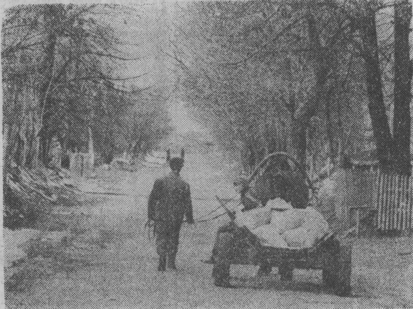
Alfred Paszko kupił wreszcie nawozy w geście