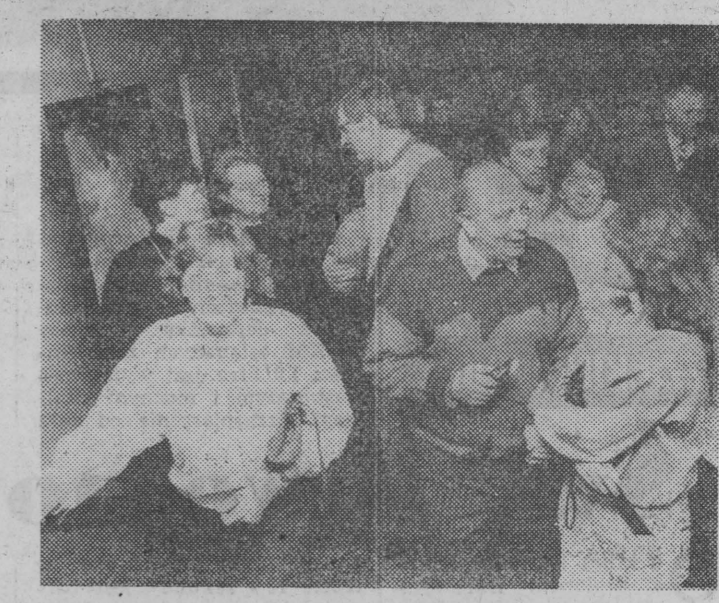
W kuluarach wymieniano wrażenia na gorąco.