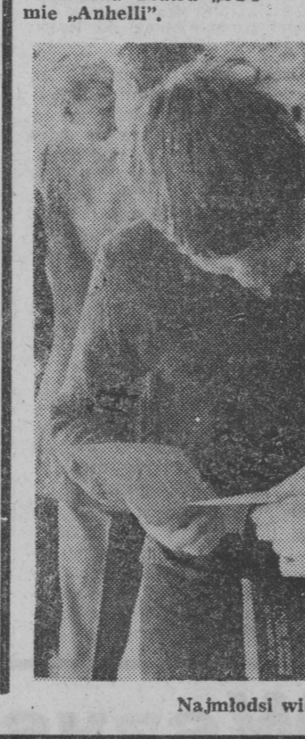
Najmłodsi widzowie Festiwalu.

W festiwalowym V Wieczorze z Wandą Warską, chyba Program uchwalony na X Zjeździe określili podstawowe kierunki działania partii. Podjęte zostaną odpowiednie decyzje. Rzecz w tym, aby zostały wcielone do codziennej praktyki (...).