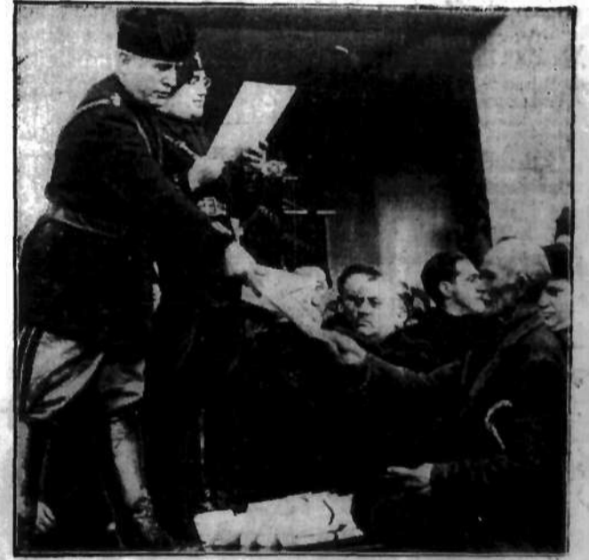
Mussołini rozdaje dyplom i nagrody 467 pierwszym mieszkańcom na stałe Littoria, powstałego niedawno na osuszonych pod Rzymem bagnach.