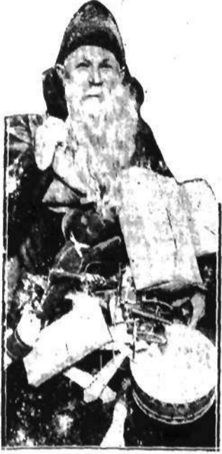
obladowany zabawkami, za chwilę szczęśliwi dziatwę zabawkami.