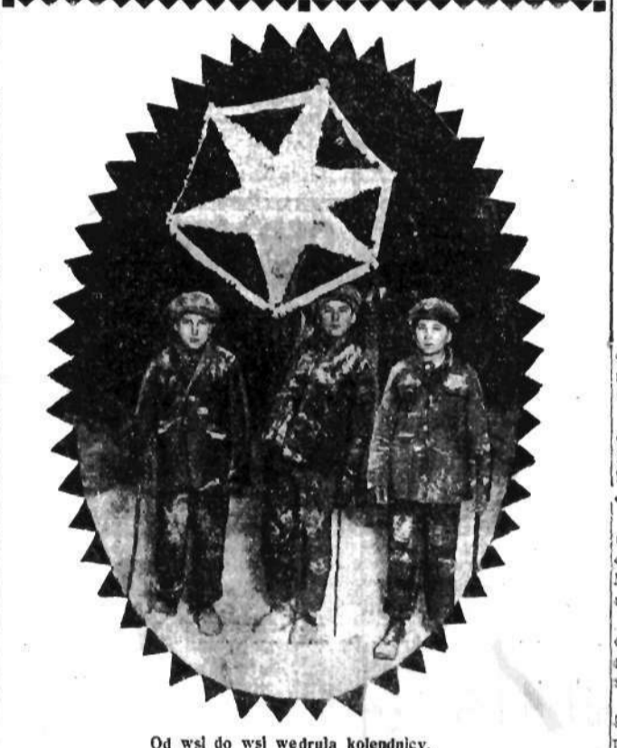
Od wsi do wsi wędrują kolendnicy.