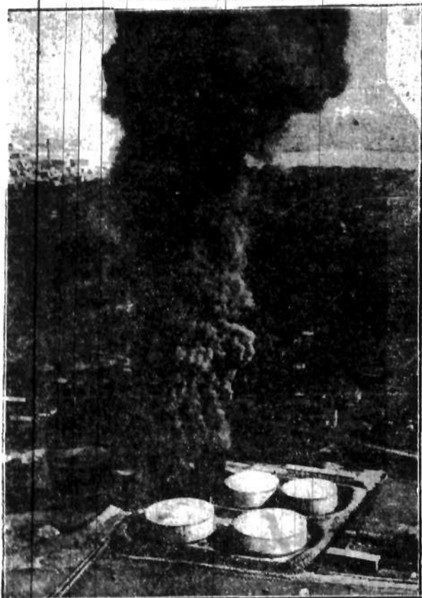
Zdjęcie aeroplanowe strasznego wybuchu zbiornika naftowego w Tiverton w Stanach Zjednoczonych. Eksplozja ta pociągnęła za sobą śmierć kilkunastu osób.