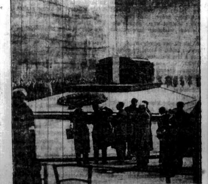
Sarkofag ze zwłokami sławnego, francuskiego bakterjologa prof. Roux, przed katedrą Notre-Dame w Paryżu, podczas uroczystego pogrzebu, który odbył się na koszt państwa.