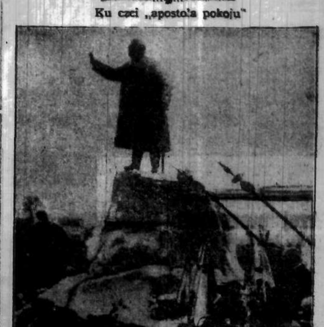
W Pacy sur Eure premier francuski Albert Sarraut dokonał odosłoneczka pomnika głośnego męża stanu Arystydesa Brianda.