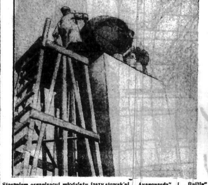
Staraniem organizacji młodzieży faszystowskiej „Avanguardia” i „Baiffa” wzniesiony jest w Rzymie pomnik formie rzeźby głowy Il Duca.