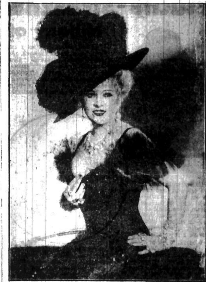
Niech żyją tegiel! Niech żyją „prawdziwi” kobiety! Pod takim hasłem wywołała popularna gwiazda filmowa Mae West rewolucję wśród płci pięknej...