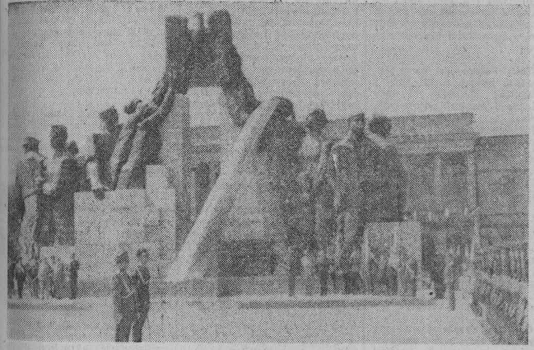
Pomnik „Poległym w służbie i obronie Polski Ludowej”