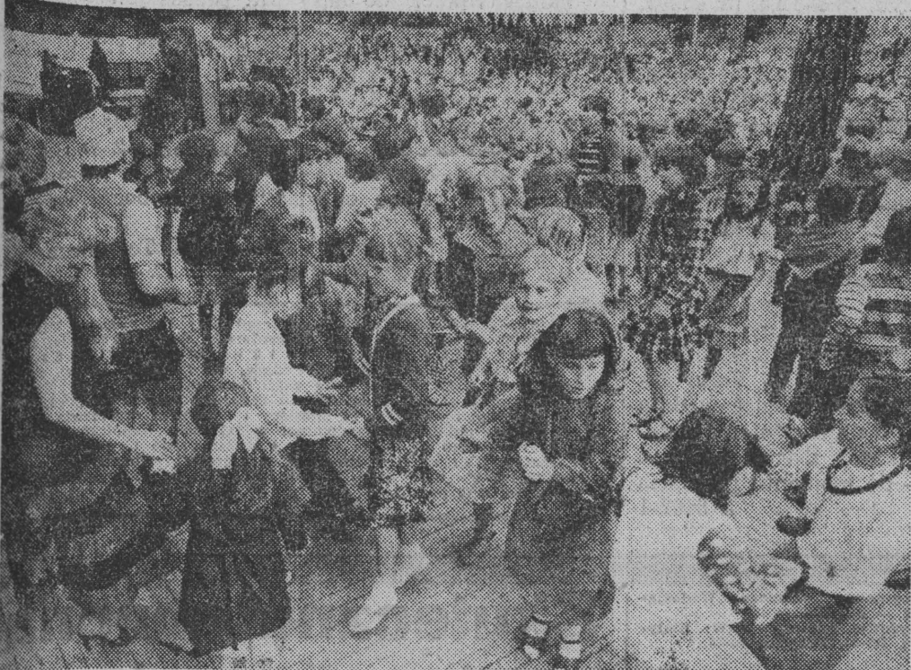
Festyn w białostockim Zwierzyniecu.

W niedzielę pogoda popsuła szki organizatorom imprez plenerowych. Przez cały dzień padał deszcz. Odbyły się jedynie imprezy klubowe. Natomiast wczoraj, w poniedziałek, licznie zjawili się mieszkańcy miasta w Parku Zwierzynieckim, gdzie na estradzie występowały zespoły taneczne, muzyczne, dziecięce i młodzieżowe z Miejskiego Domu Kultury, Spółdzielczego Domu Kultury oraz Teatr Poeszii „Pro”, folklorystyczny zespół