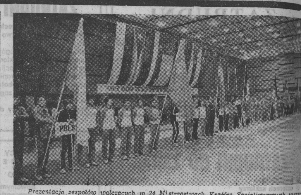
Prezentacja zespołów walczących w 24 Mistrzostwach Krajów Socjalistycznych w siłach mierze.

Dużą frajdę sprawili sobie studenci podczas Międzyuczelnianego Dnia Sportu. Oprócz wielu sportowych zmaganiach przeprowadzili bowiem konkurencje typowo rozrywkowe.