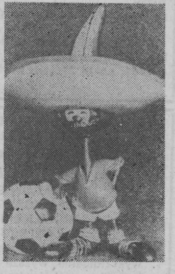
Metz (Francja). Półtora miliona statuetek „Pique” — maskotki piłkarskich mistrzostw świata wyprodukują zakłady „Petitcollin” w Metz.