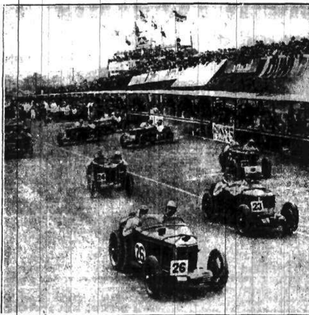
W Ulster odbyły się najpopularniejsze angielskie wyścigi samochodowe. Na zdjęciu spóźnawidzące samochody przed startem.