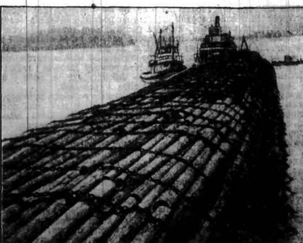
Na rzece Columbia w Stanach Zjednoczonych odbywa się kolosalny spław drzewa. Transporty drzewne dochodzą do 300 metrów długości.