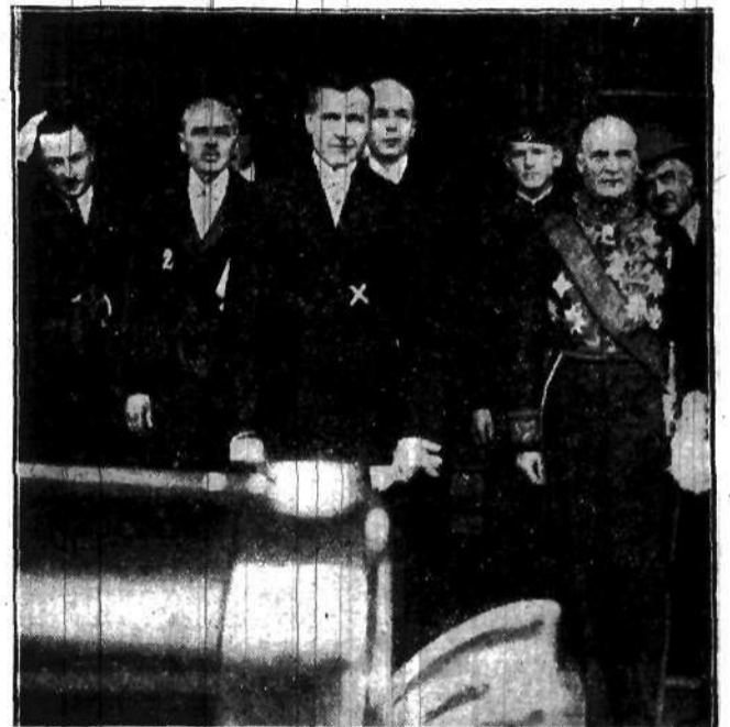
Wczoraj Prezydent Rzplitej przyjął nowego ambasadora Stanów Zjednoczonych p. Cudaby. Na zdjęciu amb. Cudaby (x), dyr. protokołu dypl. hr. Romer (t) i radca Grosly (2) przed odjazdem na audyencję.