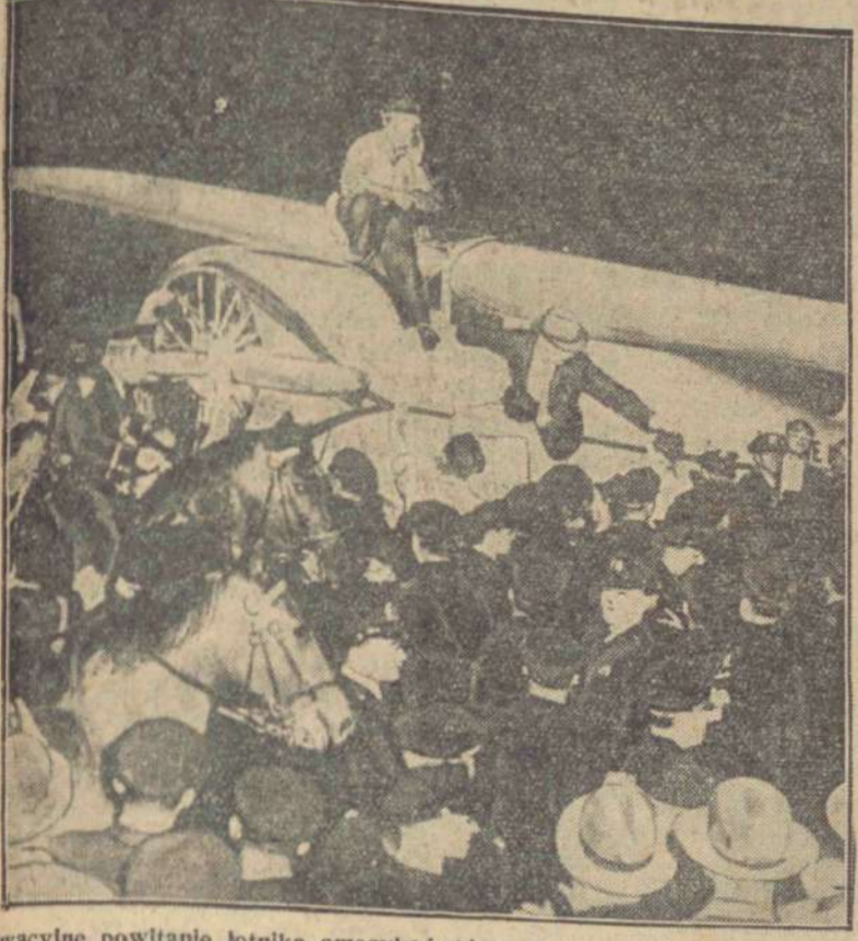
Owacyjne powitanie lotnika amerykańskiego Posta na lotnisku w Nowym Jorku po dokonaniu brawurowego lotu naokoło świata.