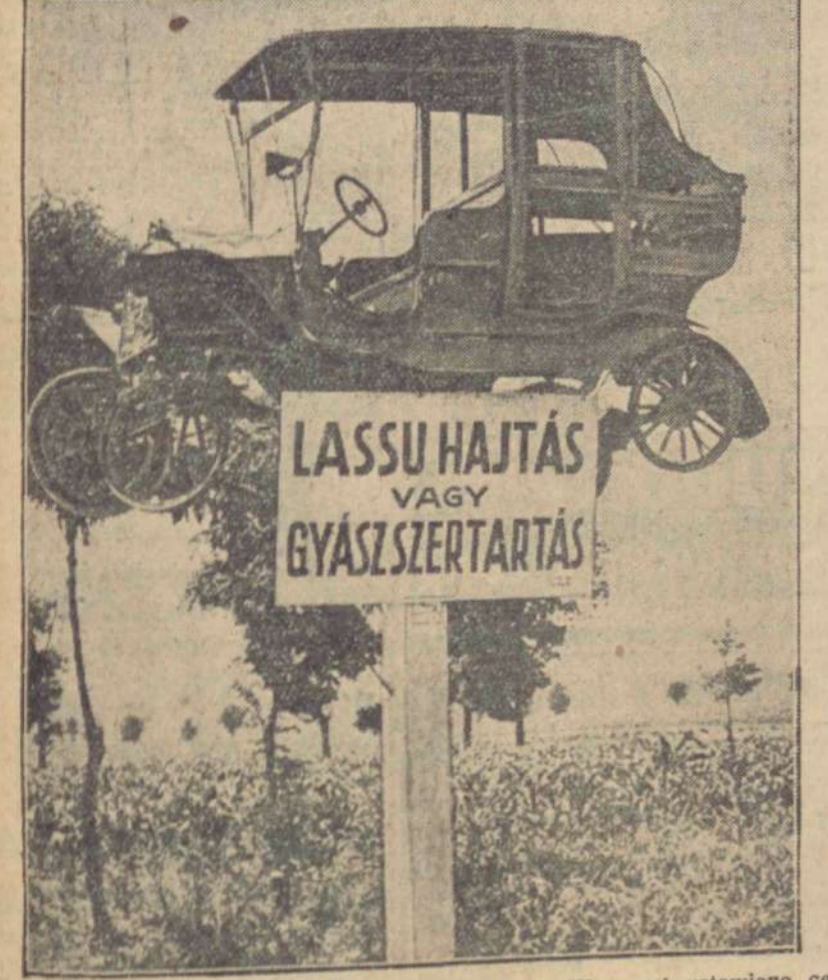
Na jednym z niebezpiecznych skrzyżowań w Węgrzech ustawiono, celem ostrzeżenia kierowców aut, rozbitły w katastrofie samochód z odpowiednim napisem.