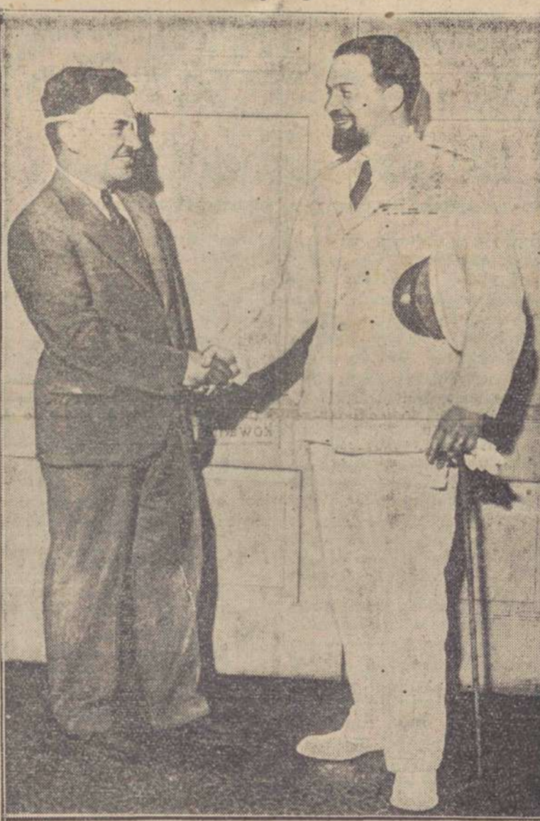
Spożkanie amerykańskiego lotnika - re kordzisty Posta z chlubą Włoch gen. Balbo.