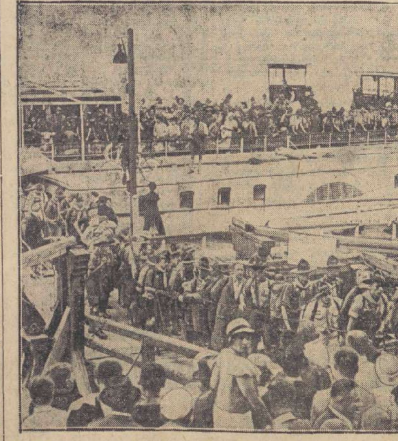
Do Wiednia przybyła, udająca się Dunajem na zlot harcerski w Gödöllö, szwajcarska grupa 500 harcerzy.