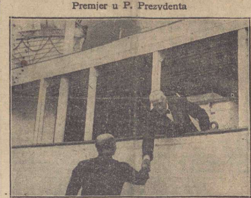
Prezident u P. Premiera. Przybyli na święto „Straży Przejazdowej” w Gdyni p. premier Jędrzejewicz, złożył wizytę szefującemu na statku „Gdynia” na morzu Panu Prezydentowi Rzplitej.