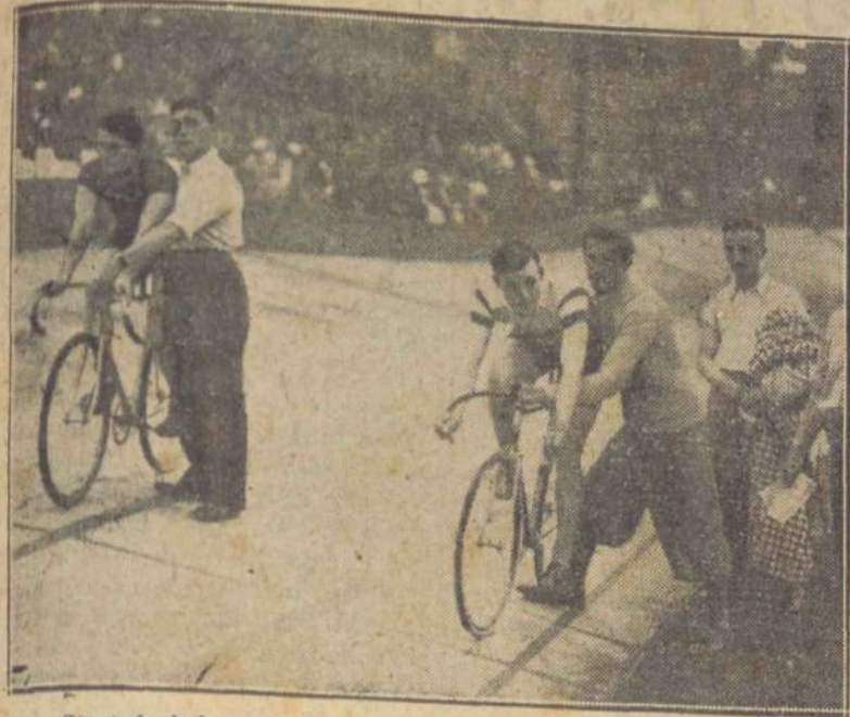
Start do jednego z wyścigów niedzielnych na Dynasach.