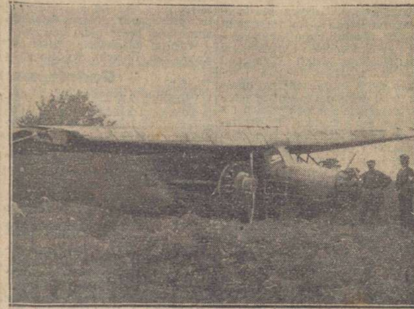
Rozbity w katastrofie pod Grodziskiem Mazowieckim samolot 1 pułku lotniczego z Warszawy. W katastrofie tej zginęła 1 osoba zśród załogi, a 2 zostały ciężko ranne

Wczoraj w kilka minut po godz. 10-ej rano zdarzył się w Otwocku przerażająca katastrofa samolotowa. Przed godziną dziesiątą nad Otwockiem i okolicznymi lasami zaczął kraść samolot wojskowy z Warszawy, lecący z Deblina do Warszawy i noszący znak rozpo-