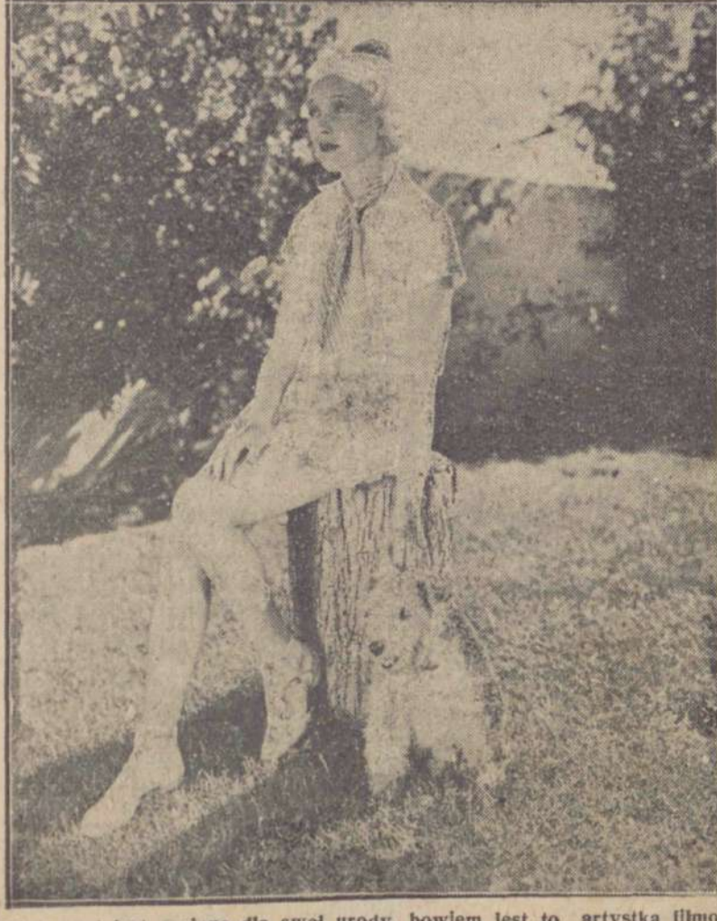
Piękna pani jest ceniona dla swej urody, bowiem jest to artystka filmowa Helen Twelvetrees. Ona zaś z kolei wysoce ceniona jest dla swego psa brzydki.