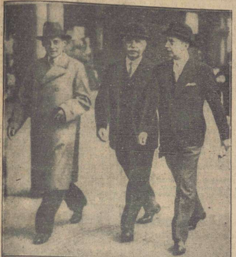
Premier Jędrzejewicz, wicepremier rumuński Mironescu i poseł polski min. Arciszewski na dworcu w Budapeszcie w czasie wizyty premiera Polski w Rumunii.