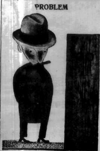
rys. Z. Wasilewski. — Czy ja tam już byłem, czy też mam dopiero zamiar być?

W ramach pierwszej i drugiej „piłki” Sowieców, między innymi, prowadzone są wielkie prace nad opanowaniem Arktyki i stworzeniem możliwości pomyślnych warunków komunikacji przez strefy Dalekiej Północy. „Szurm na Arktydę” — pod tem hasłem organizowane były wyprawy polarne celem zbadania możliwości przyszłej drogi handlowej z Europy do Azji i Ameryki — przez Ocean Lodowaty.