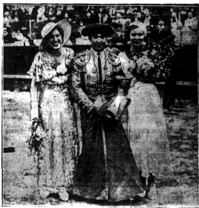
Niemiecka i węgierska królowe piękności na walkach byków w Hiszpanji w towarzystwie sławnego torreadora.