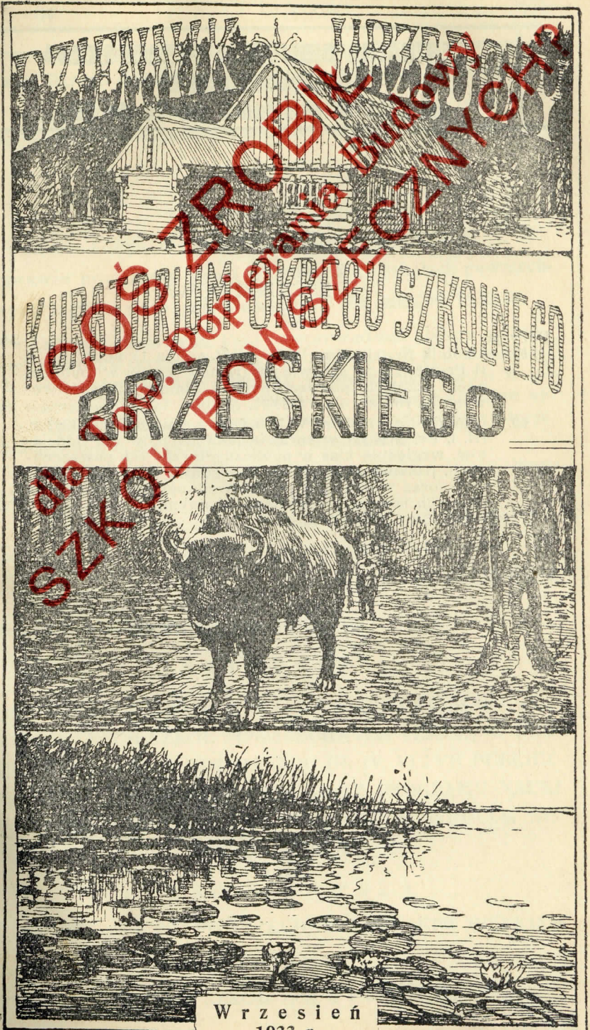
Wrzesień 1933 r.