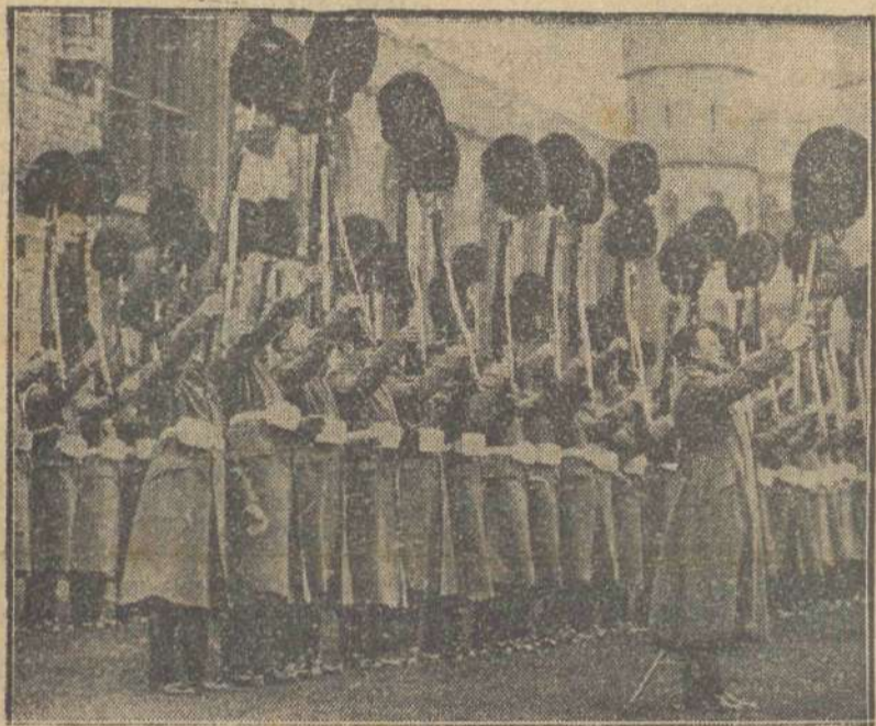
Żołnierze gwardji Walijskiej urządzili owocne powitanie ks. Walii, ich szefowi, wyrażające się w podrzucaniu szych czako na bagnietach.