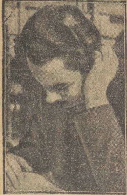
Do Paryża przybył arcyksiążę Otto Habsburg, pretendent do tronu austro-węgierskiego. Młody książe przygotowuje się na uniwersytecie paryskim do pracy doktorskiej.