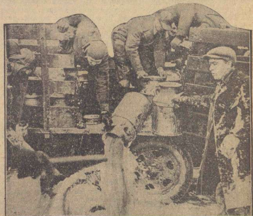
W staniu Wisconsin w St. Zjedn. farm erzy wylewają nadmiar mleka, chcąc tego ceny utrzymać na określonym poziomie.