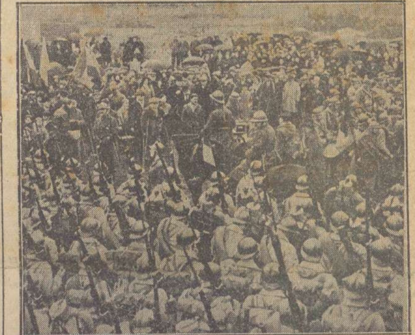
W tych dniach we Francji pułk z Cambrai z orkiestrą i rozwiniętym sztandarem udał się do włoski, oddalony o 10 km. na dekorację krzyżem Legji Honorowej swego kolegi, który jako ka leka bez nóg nie mógł przybyć do pułku. Na zdjęciu dekorowany in walida, stoi na kulach koło konia.