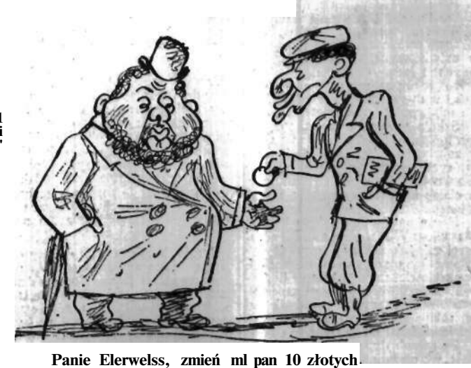
Panie Elerwells, zmień ml pan 10 złotych. Mogę na dwa płatki. Co znaczy na dwa płatki? S złotych w ten platek, drugie 5 w następny.