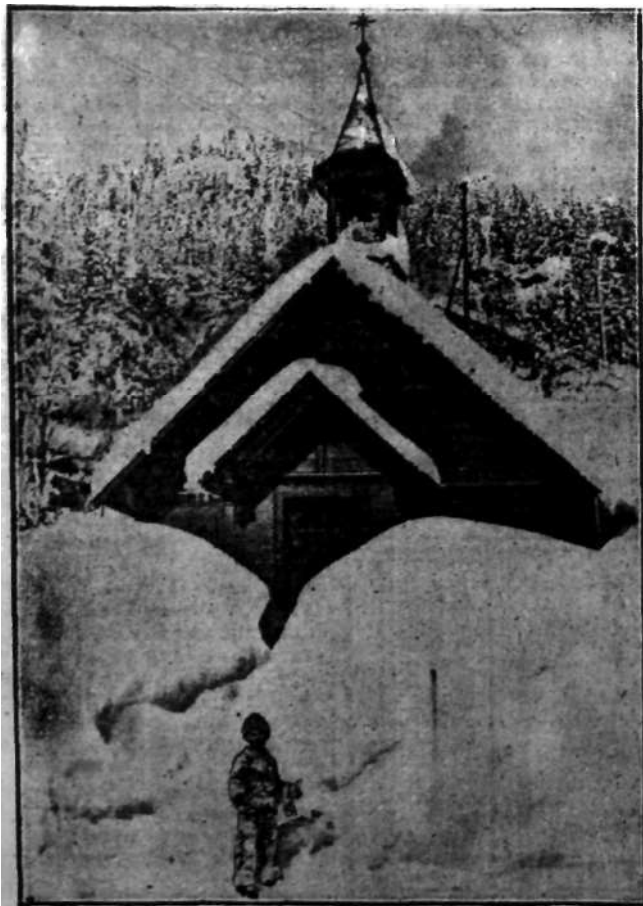
JU*Jul wttUU * okuczach Morgan w Norwegi.