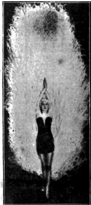
Tancerka kimcKO z kabaretów londyń- skich w fantastycznym stroju z piór strusich, robi wrażeń'e wielkiego pta- ka ralskisco.