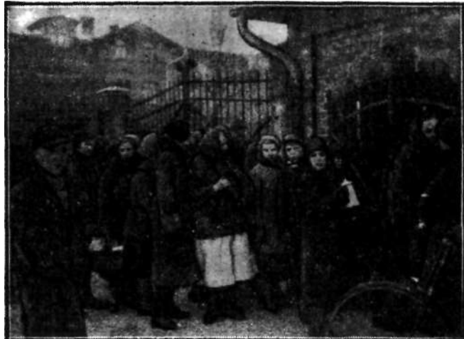
V bram kop. „Pokor w Nowym Bytomiu, gdzie brzebywa 1.000 stralkula- cyu górników, tłoczą sie matki, żony I dzieci, przybyte z pożywieniem.