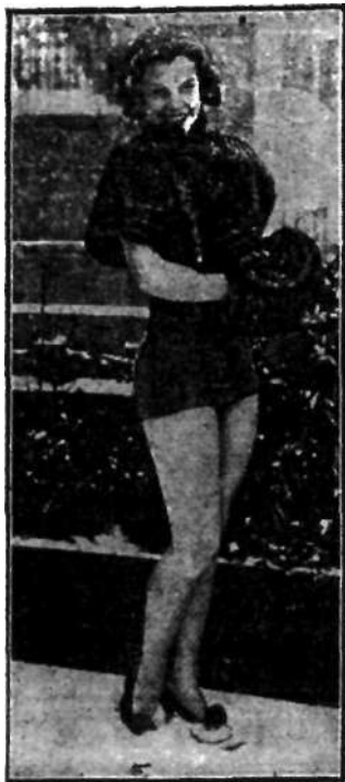
Smele i'e piękne dziewczę, tle ale leśt do szczyr śmiech. W takim lckk'm Mmli na Me n? W raczki i tzyie cie- plo. ale reszta..