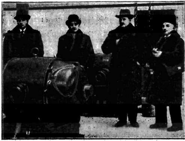
Przebywający w stolicy rumuński wiceminister spraw wewnętrznych p. Radolescu z rodziną. W tle: wiceminister spraw wewnętrznych p. Radolescu, wiceminister spraw wewnętrznych p. Radolescu, wiceminister spraw wewnętrznych p. Radolescu.