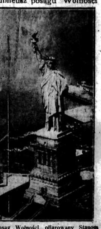
Posąg Wolności, ofiarowany Stanom Zjednoczonym przez Francję i ustawiony na wyspie Bedloe w porcie Nowego Yorku w tych dniach obchodził 50-letnie uroczyste odsłonięcie.