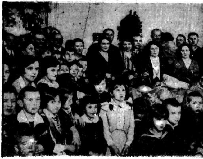
W Warszawie odbyła się onegdaj gwiazdka dla dzieci funkcjonariuszów policji państwowej, zorganizowana staraniem Rodziny Policjantów...