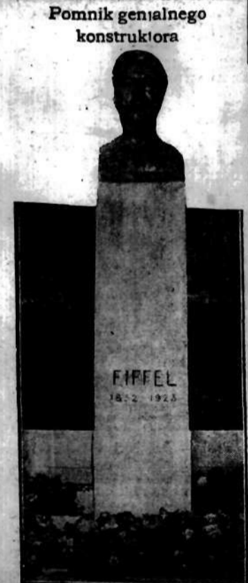
Pomnik genialnego konstruktora

W związku z obchodem 100-letniej urodziny inż. Gustawa Elfla, odbyło się wczoraj uroczyste odsłonięcie popiersia zasłużonego konstruktora, a stóp słynnej wlezy Elfla w Paryżu.