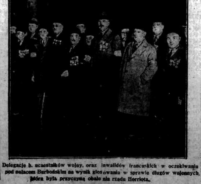
Delegacja b. uczestników wojny, oraz inwalidów francuskich w oczekiwaniu pod pałacem Burbońskim na wynik głosowania w sprawie długów wojennych, która była przyczyną obalenia rządu Herriota.