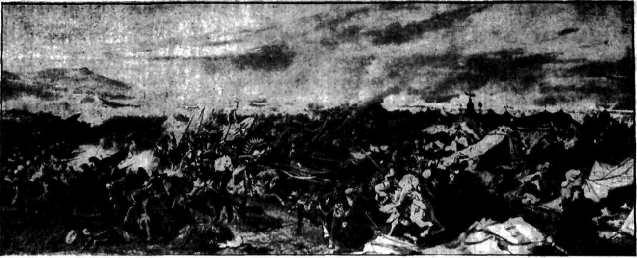
Wspaniały obraz Józefa Brandta, przedstawiający „Odsiecz Wiednia” i nabyty niedawno przez Muzeum Narodowe za sumę 7.000 marek...