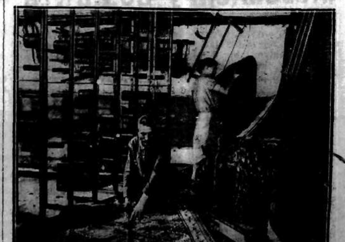
Oto już gotowy dywan. Zwijają go i składają staramie.

Mężczyźni, kobiety i dzieci, jak to widać na zdjęciach, pracują wspólnie w tym przemyśle.