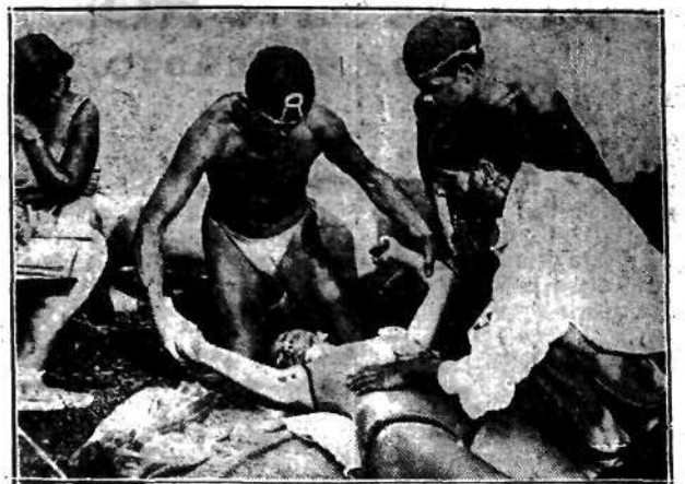
Niemca-memal dnia bez kłuku, a nawet kilkunastu wypadków utonięcia w rzece, czy morzu. W wielu wypadkach udaje się, na szczęście, tonących odratować. Na zdjęciu uwieczniono taką chwilę ratowania. Stosują sztuczne odychanie, a także nowy sposób przytrzymywania języka ofiary.