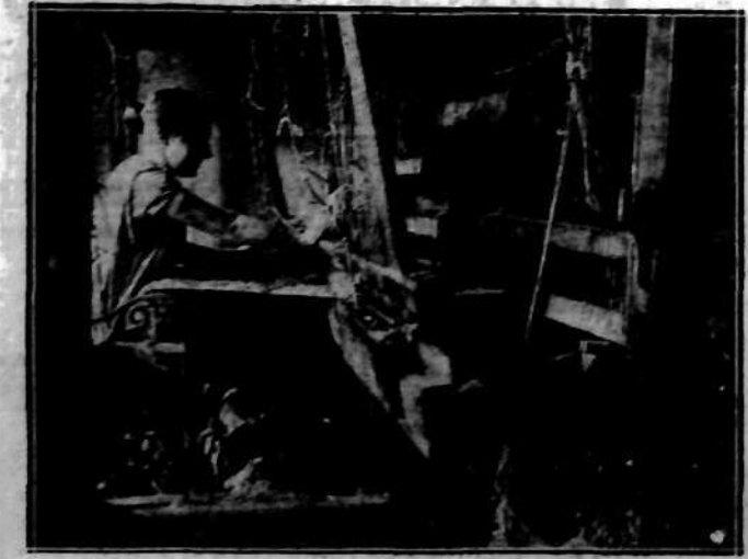
Kobiety z całej wsi spędzają dnie przy prymitywnym warsztacie tkackim, pamiętającym dawne czasy.