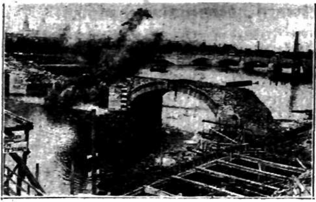
Wysadzenie w powietrze starego mostu na rzece Maas w Holandji. Widać w oddali nowy most.