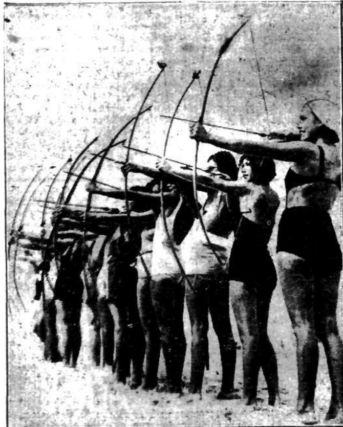
Te oto kobiety to nie żony dzielnego plemienia nieustraszonych Siuksów, czy innych czerwonoskórych, ale amerykańskie panienki, ćwiczące się w łucznictwie na plaży w Virginia Beach.